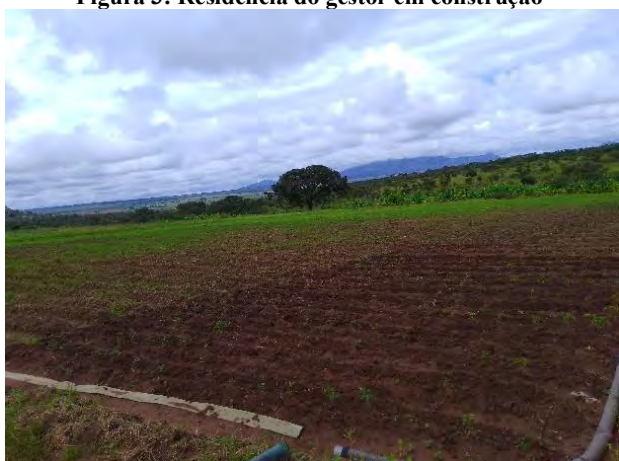
Figura 5: Campo agrícola