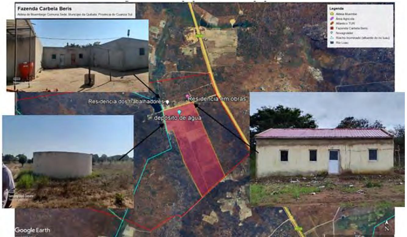
Figura 2: Base de vida