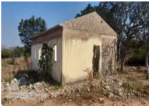
Figura 3: Residência do gestor em construção