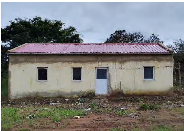
Figura 4: Residência inacabada