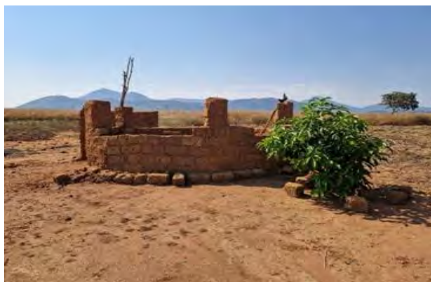
Figura 7: Cacimba