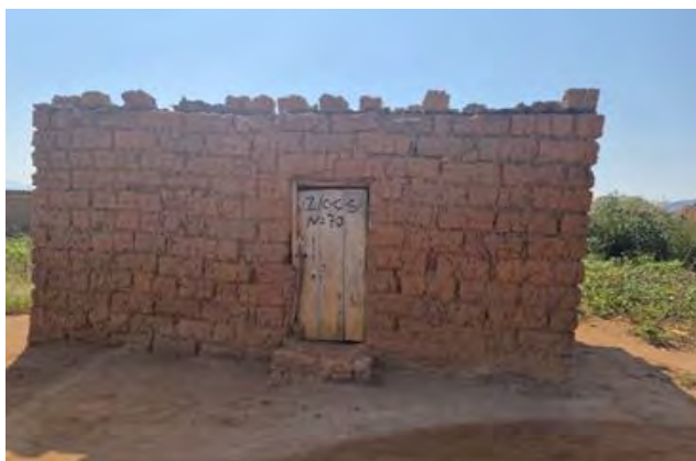
Figura 6: Armazém