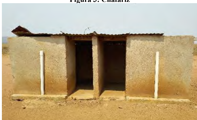
Figura 5: Casa de banho comunitária separa por género