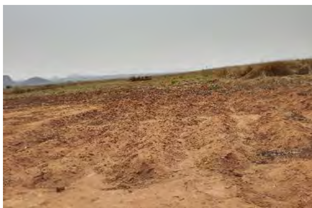
Figura 9: Área agrícola