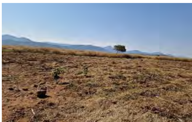
Figura 8: Área agrícola