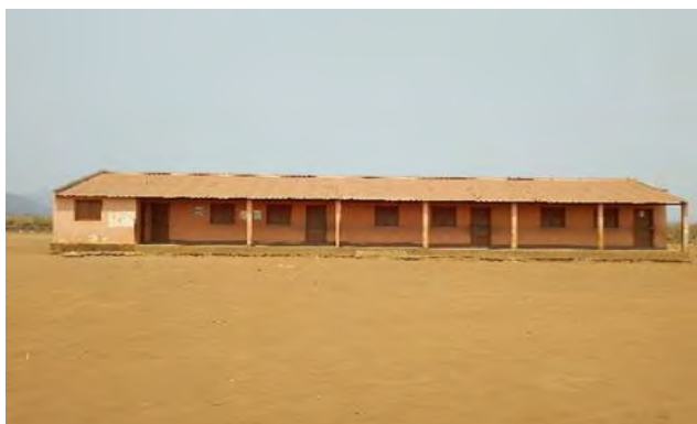
Figura 2: Escola do primeiro Ciclo