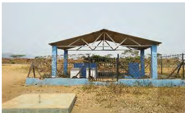
Figura 3: Chafariz