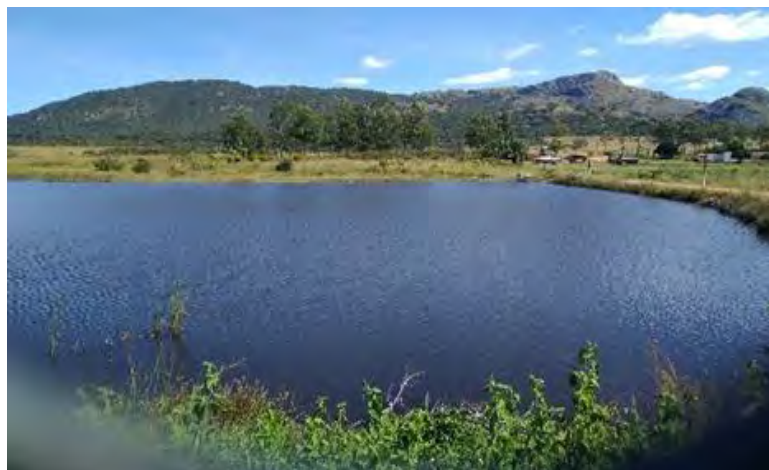
Figura 2: Reserva de água (represa)

Tendo em conta o clima da região em que os valores das especificações pluviométricas anuais ultrapassam os 1000 mm, as necessidades hídricas das culturas serão supridas pelas chuvas. O fazendeiro deverá garantir reservatórios adequados e devidamente higienizados para o armazenamento da água para o consumo humano. No que diz respeito aos recursos hídricos é atravessada pelo riacho Luati, apresenta um curso normal e caudal permanente. Por outra no interior há uma reserva de água (represa), ambas as fontes de água, servem para o consumo dos trabalhadores, recomenda-se que seja tratada (com lixívia para desinfestação da água para consumo humano) e armazenada em recipientes adequados e higienizados.