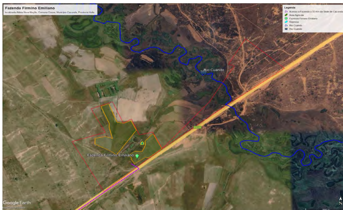
Figura 3: Área agrícola da fazenda