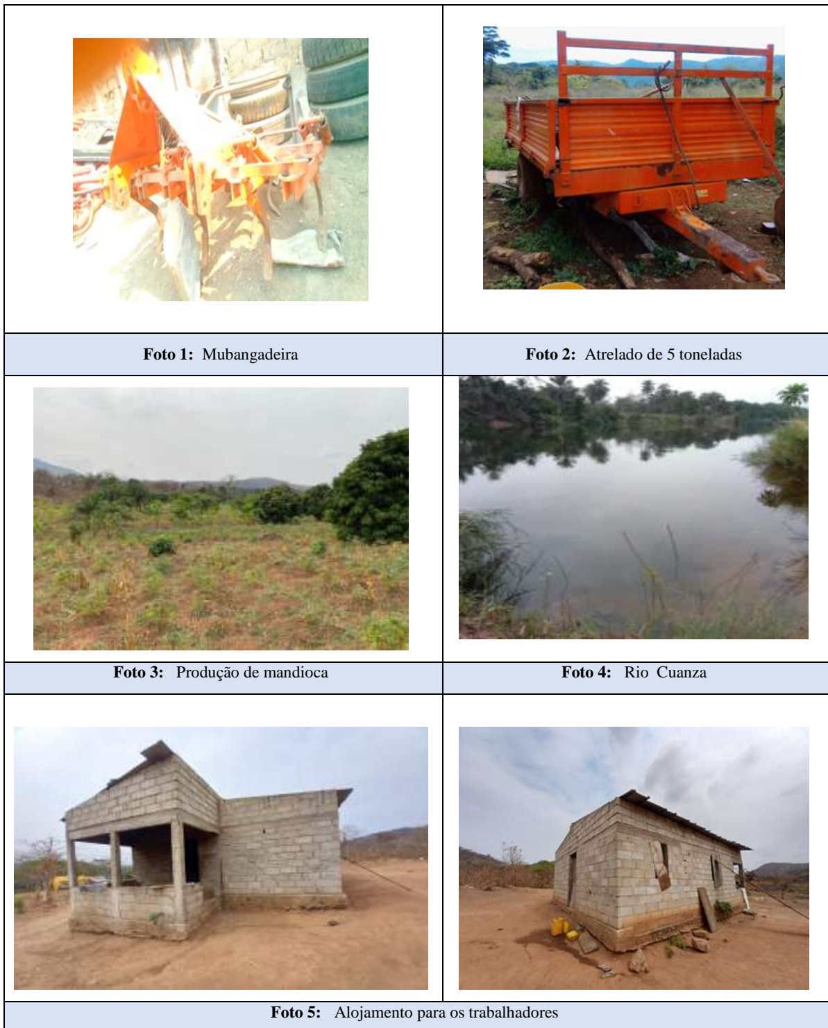
Figura 4 Registo fotográfico da Fazenda Paulo Cristovão André