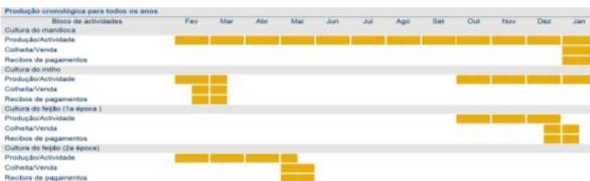
Figura 3 Cronograma da produção

A figura a seguir demonstra a produção cronológica para todos os anos para a produção da mandioca, milho e feijão.