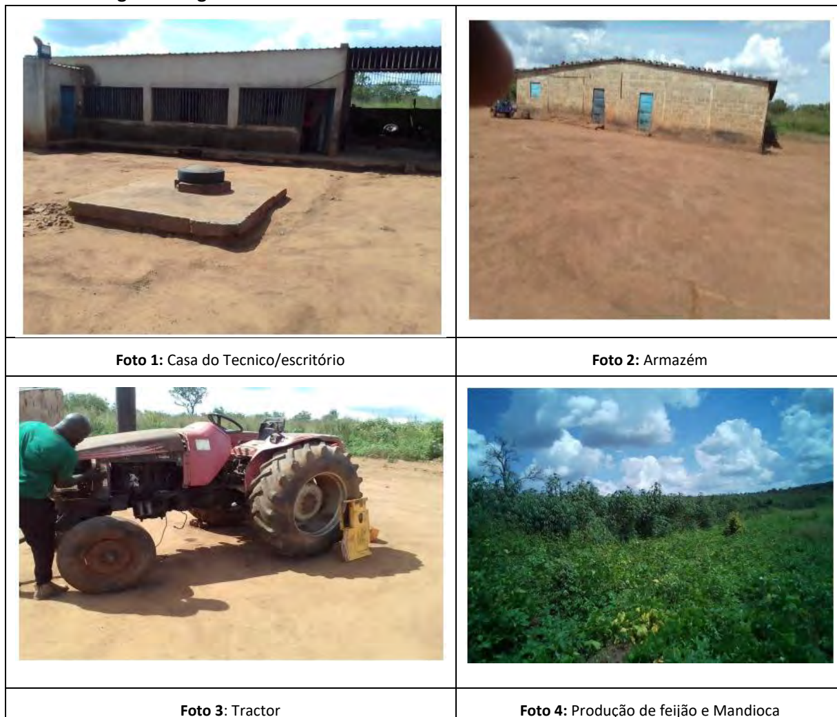
Figura 3. Registo fotográfico da Fazenda