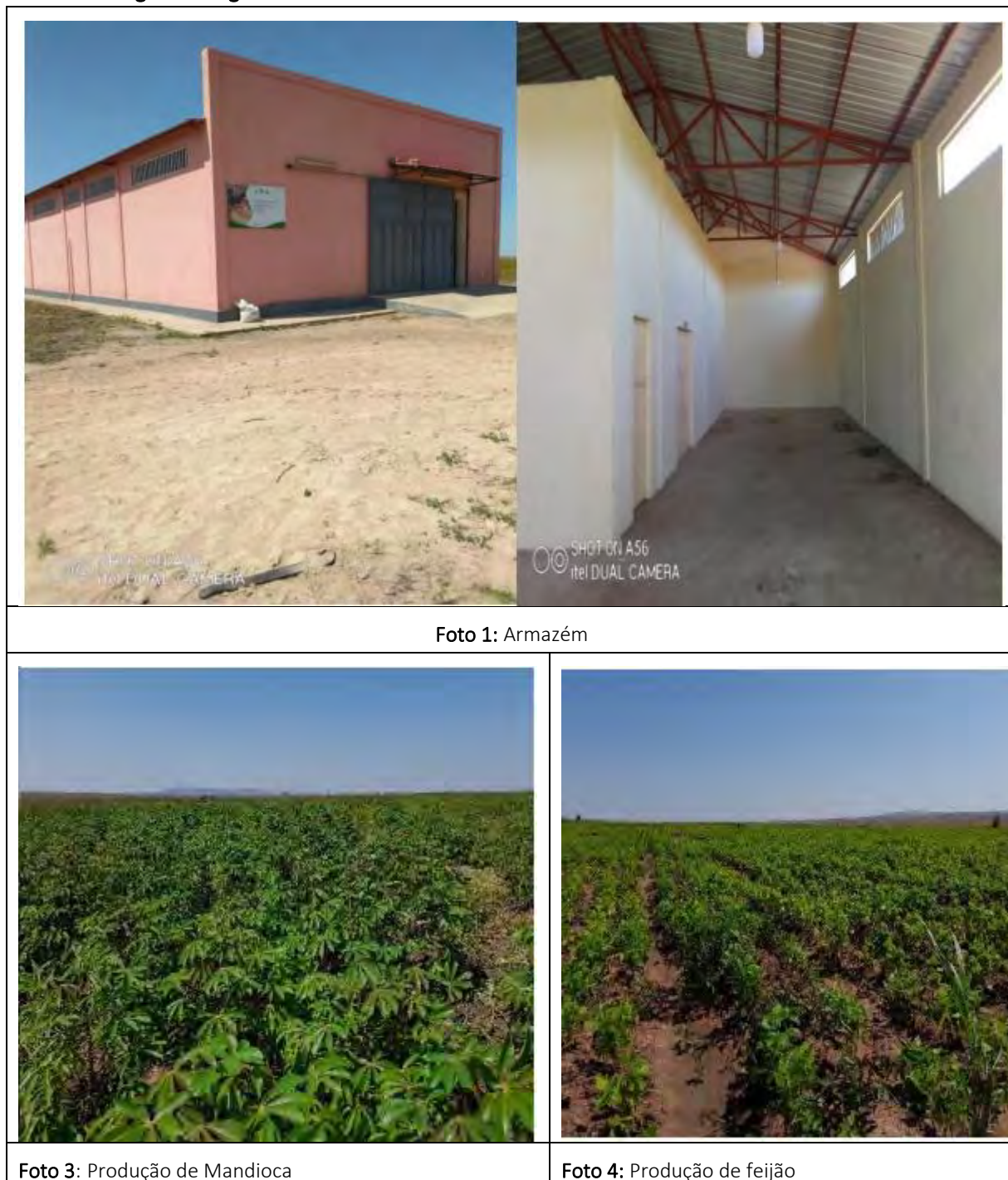
Figura 3. Registo fotográfico da Cooperativa