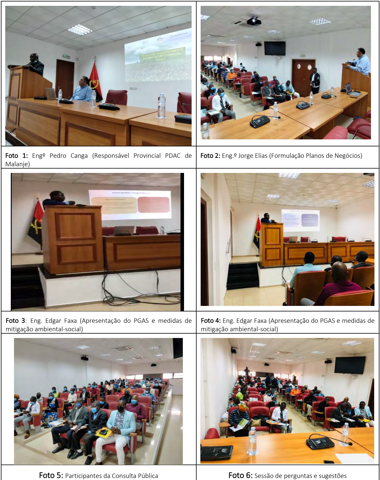
Foto 1: Engº Pedro Canga (Responsável Provincial PDAC de Malanje)