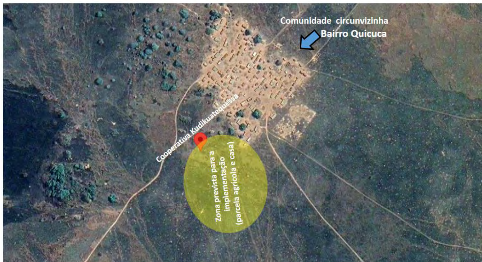
Figura 1. Mapa de localização e identificação da Cooperativa Agro-pecuária Kudikuatequessa

Coordenadas Geográficas: -9.396411, 16.180668