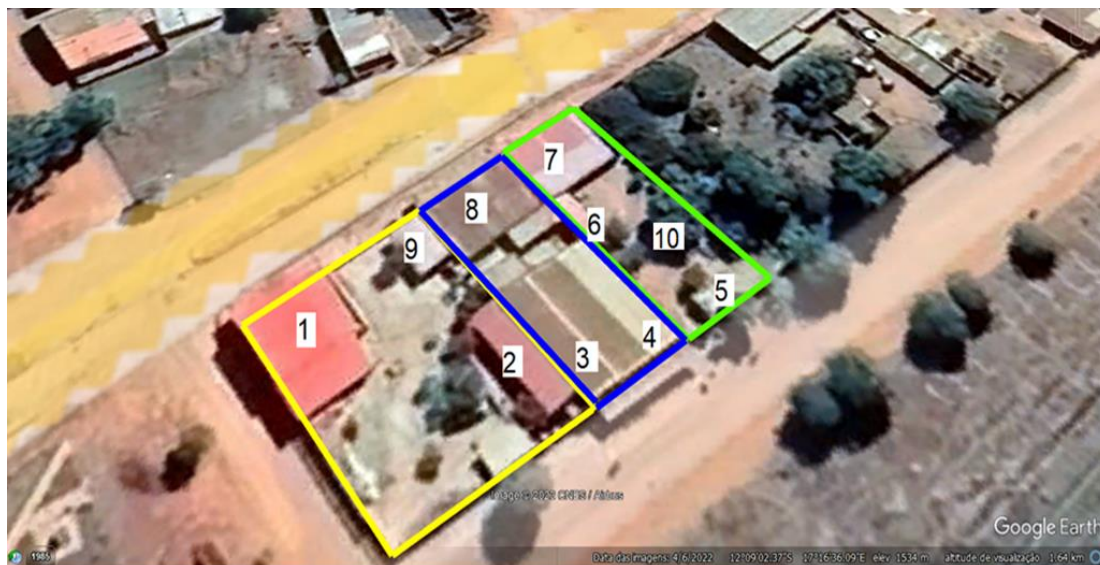
Figura 3: Observação das infra estruturas existentes na área da Empresa SOCILU LDA: N° 1 – Residência, Loja e Escritórios; 2 – Alpendre; 3 – Armazém e Loja de Materiais de construção; Armazém de produtos Agrícolas; 5 – Residência; 6 – Pequeno Armazém inacabado; 7 – Residência e Loja de Gás; 8 – Loja de compra de produtos do campo e Farmácia e Residência por trás; 9 – Alpendre e 10 - Residência