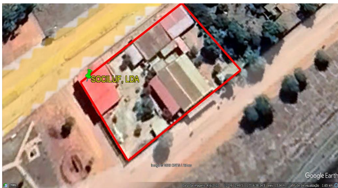
Figura 2: Observação em pormenor da área de 2 320 m 2 (58*40 m) que ocupa a Empresa Sociluf Lda (linha vermelha) de acordo com os dados obtidos no terreno pela Equipa da Sírius/BRLI, com imagens Satélite da CNES/Airbus de 04/06/2022.