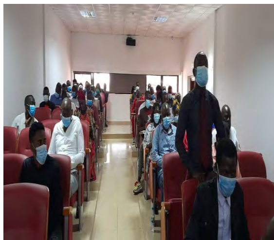
Participantes/Sessão de perguntas e sugestões