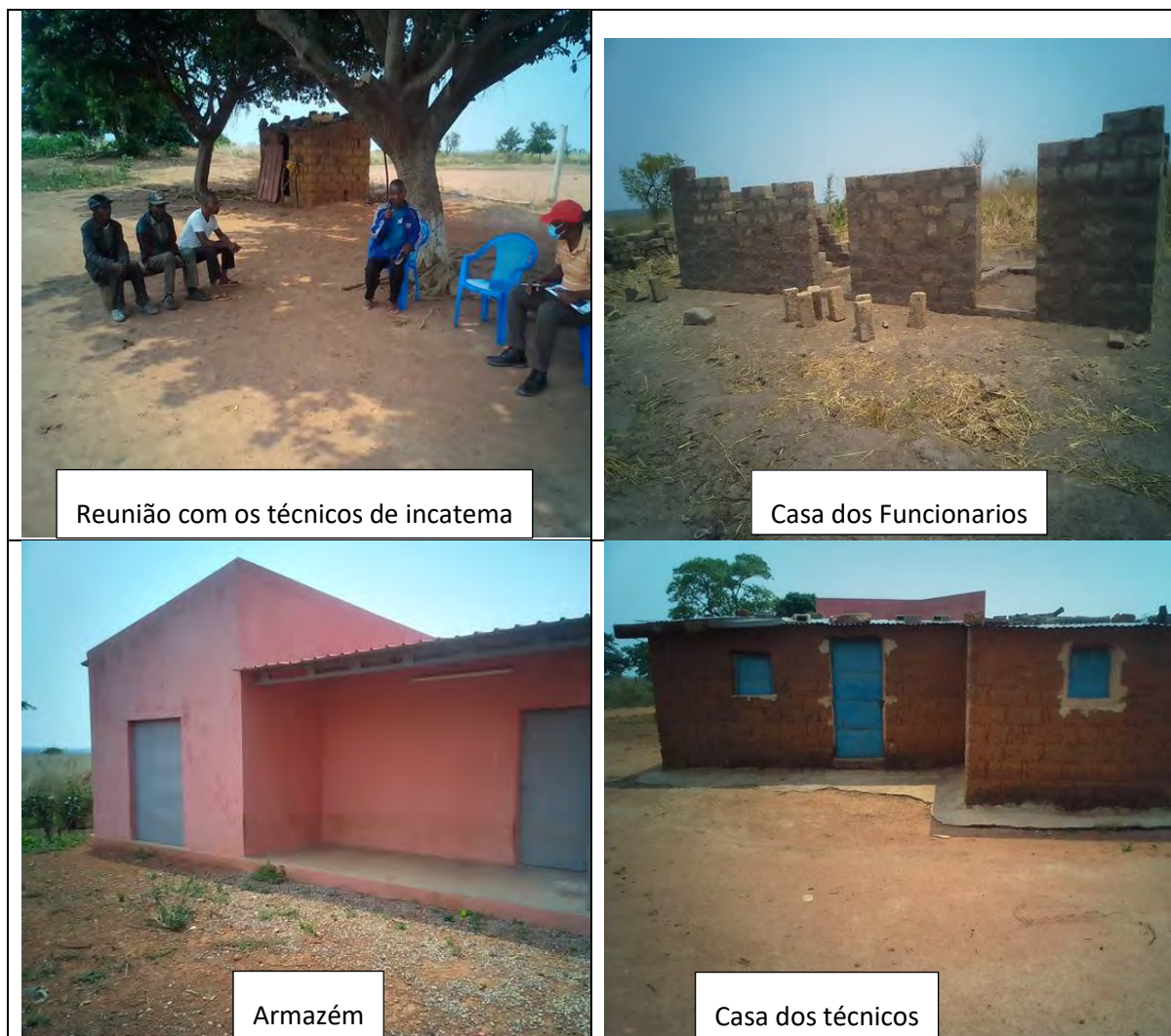
Figura 4 Registo fotográfico da Fazenda