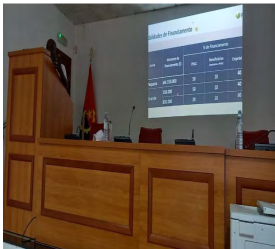
Engº Pedro Canga Malanje (Responsável Provincial PDAC em