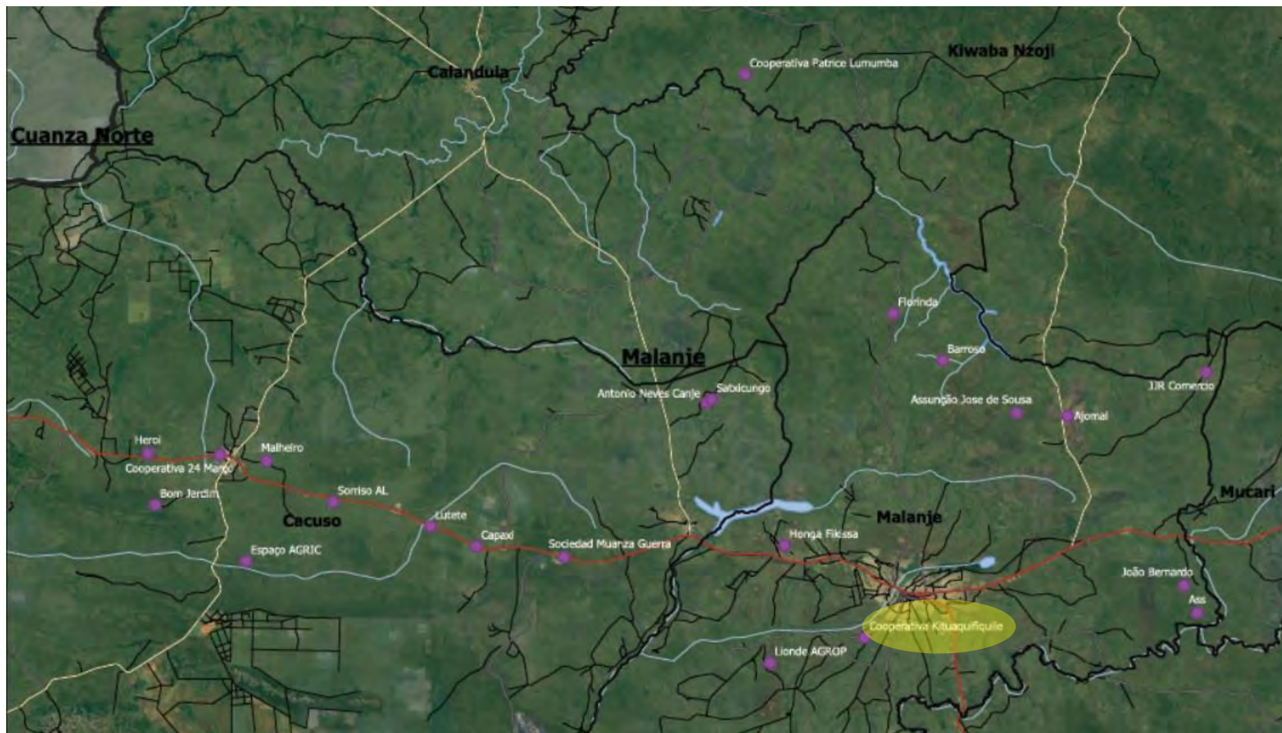
Figura 1 Mapa de georeferenciamento dos planos de negócios- corredor A