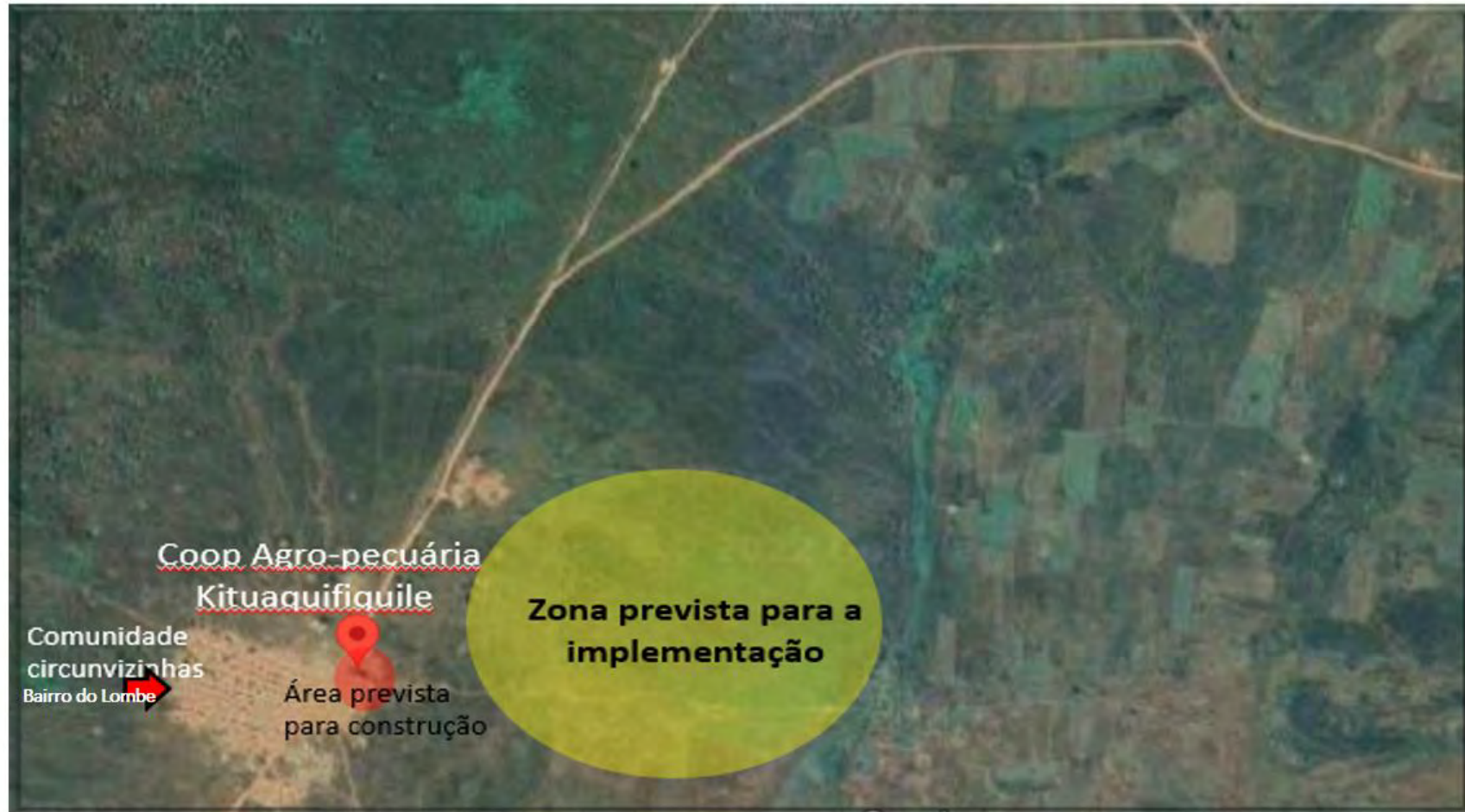
Figura 2. Mapa de localização e identificação da Cooperativa Agro-pecuária Kituaquifiquile