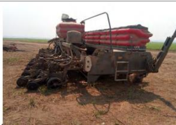
Foto 8: Equipamento de produção agrícola – Semeadora/adubadora para grãos