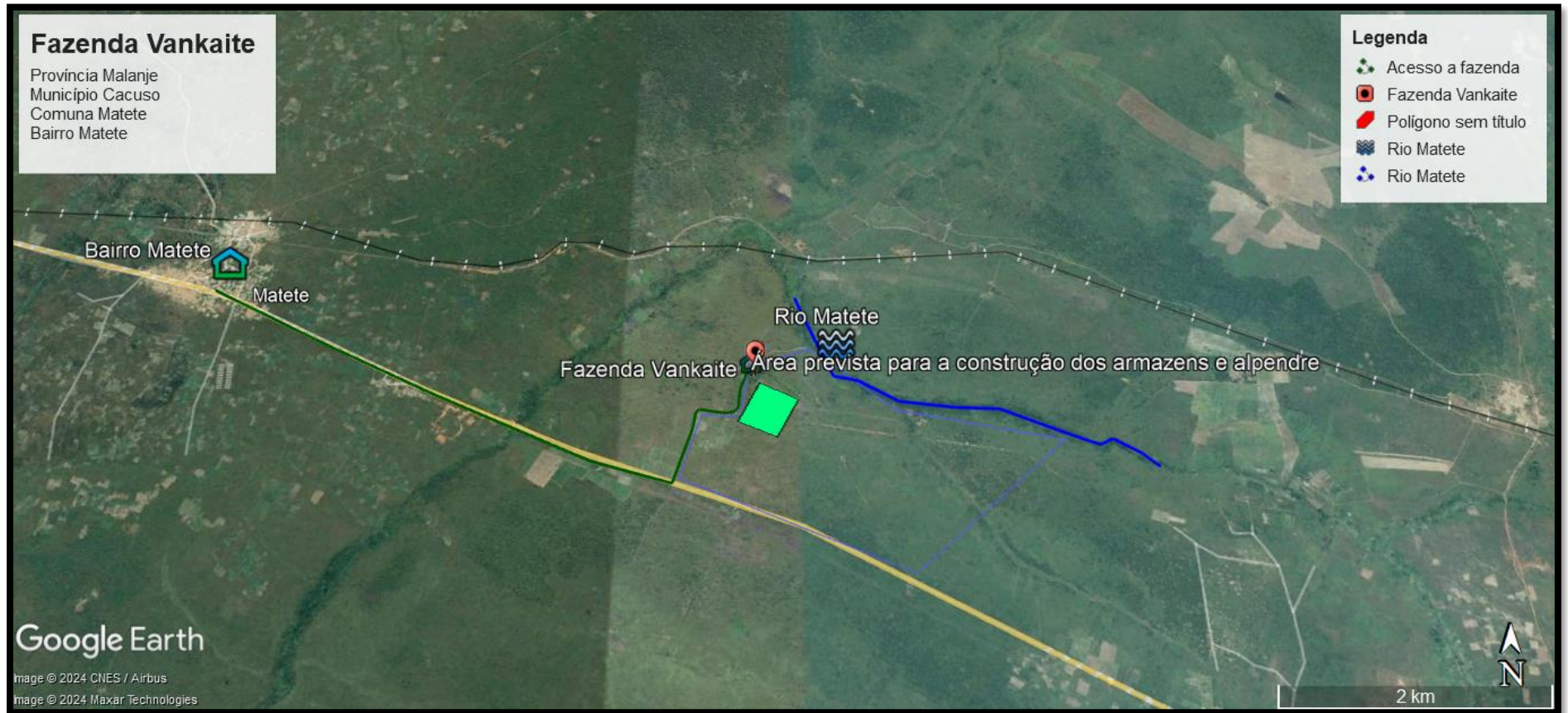
Figura 1 Mapa de localização e identificação da fazenda