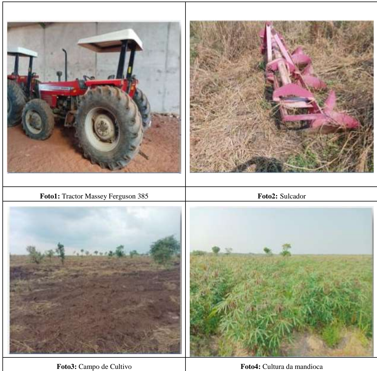
Figura 4 Registo fotográfico da Fazenda