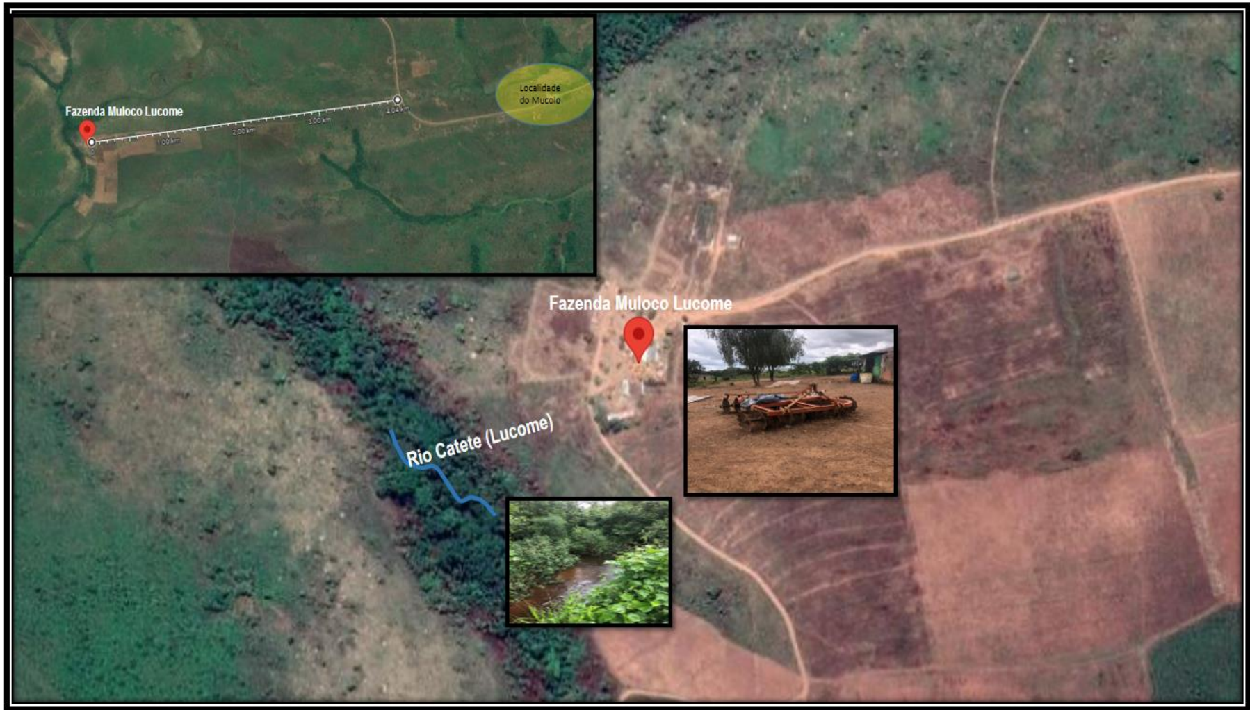
Figura 1 Localização e identificação da Fazenda