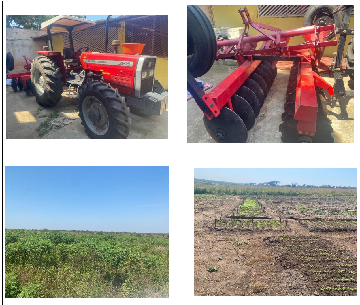
Figura 3 Registo fotográfico da Fazenda