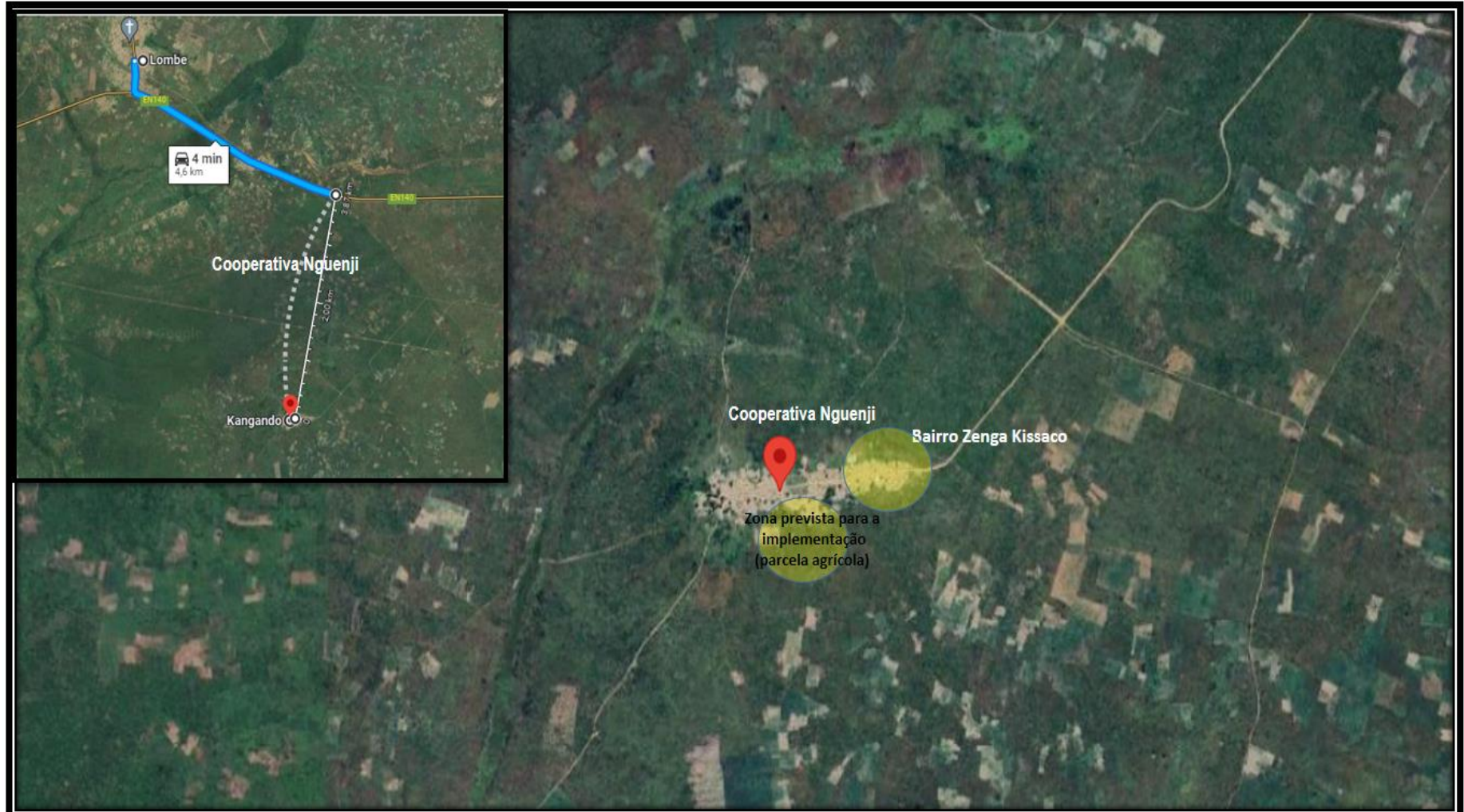
Figura 1. Mapa de localização e identificação da Cooperativa Nguenji