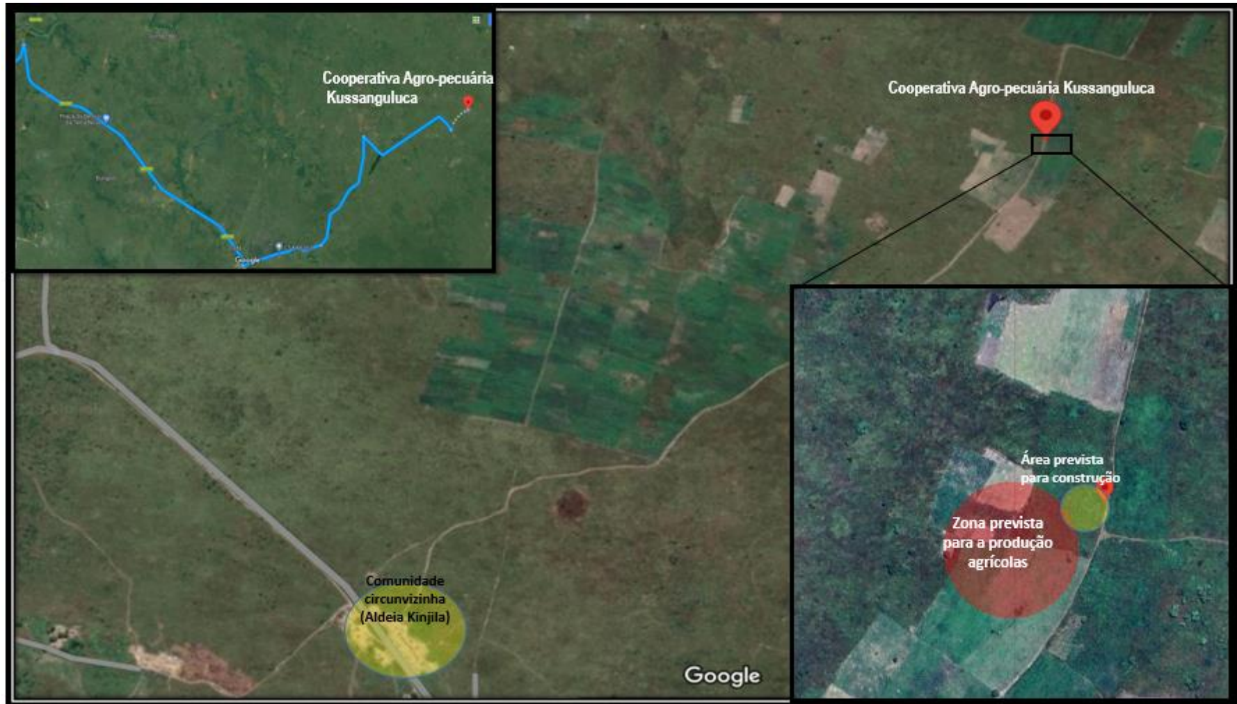
Figura 1. Mapa de localização e identificação da fazenda