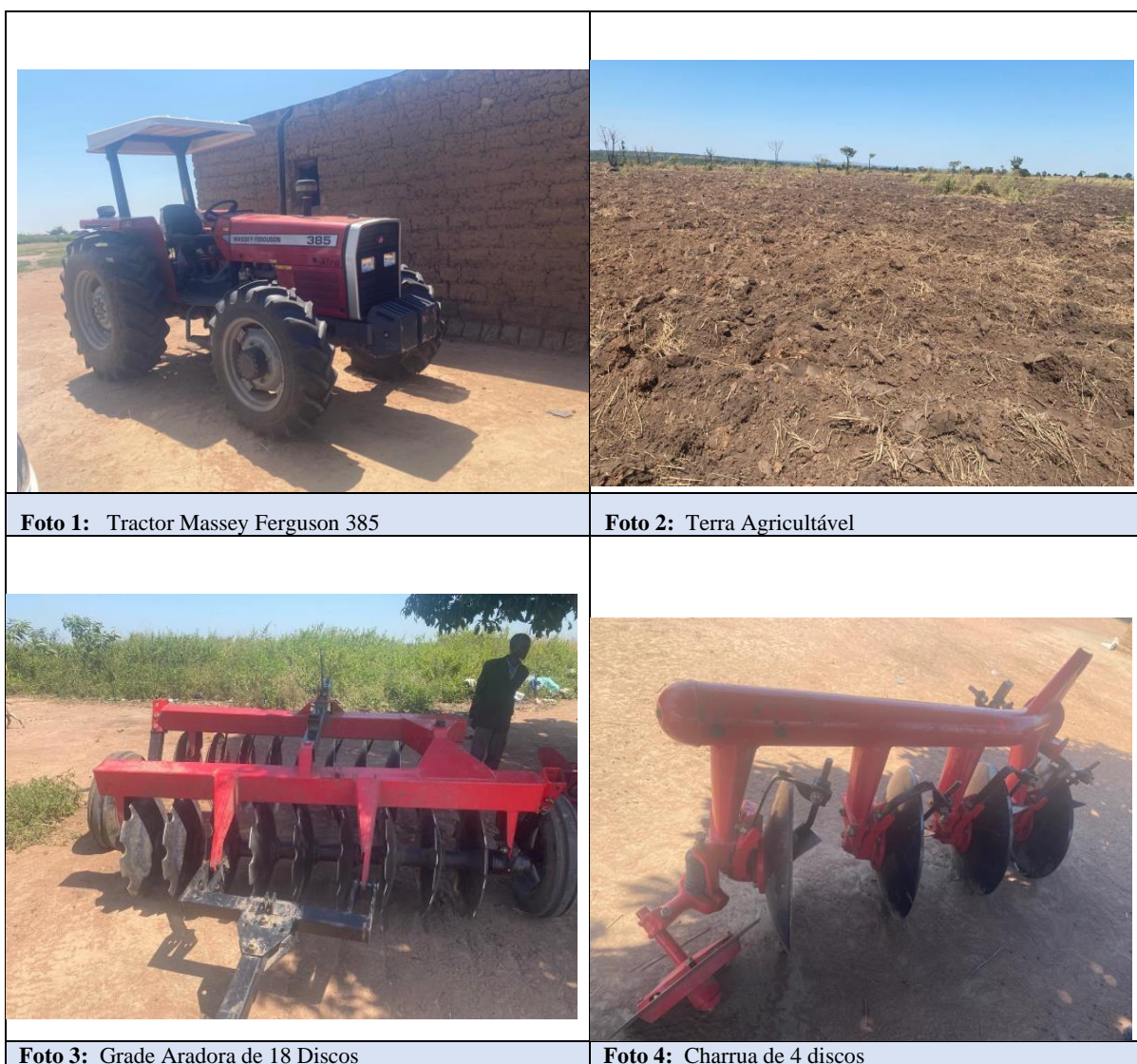
Figura 3 Registo fotográfico da Fazenda