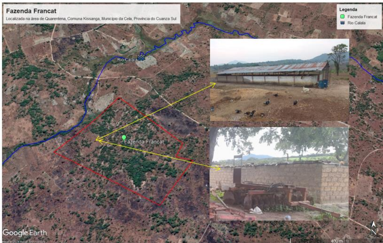
Figura 3: Infraestrutura da fazenda (fig. em cima: curral, fig. em baixo residência dos trabalhadores)