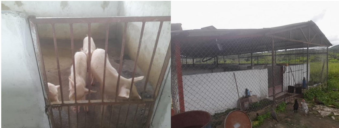
Figura 8: Curral