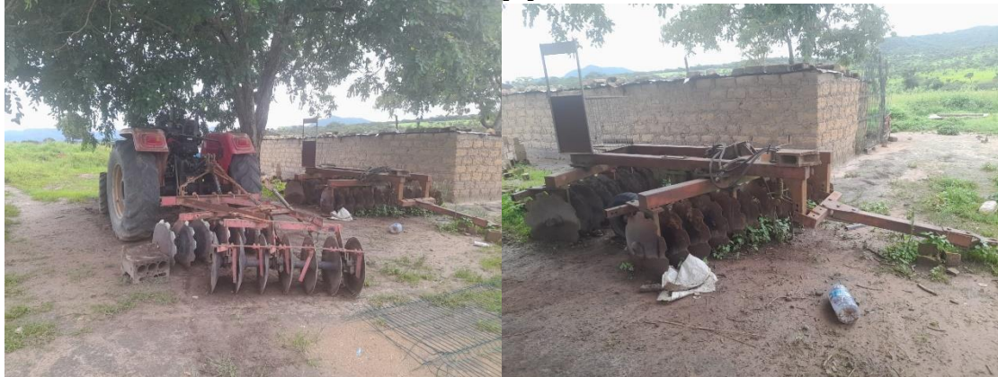
Figura 5: Equipamento e infraestruturas