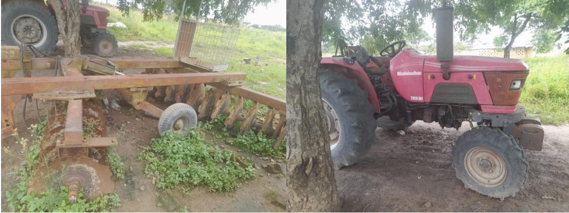
Figura 4: Equipamentos