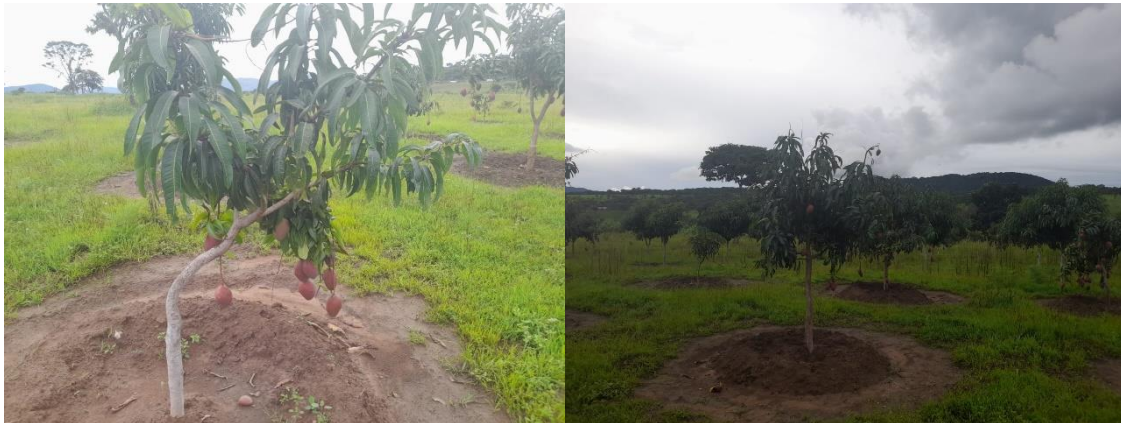
Figura 6: Campo de cultivo