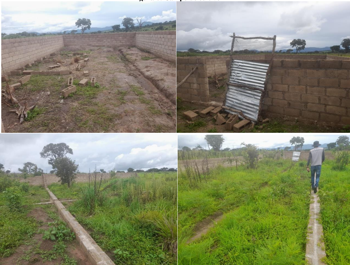
Figura 7: Infra estruturas em obra