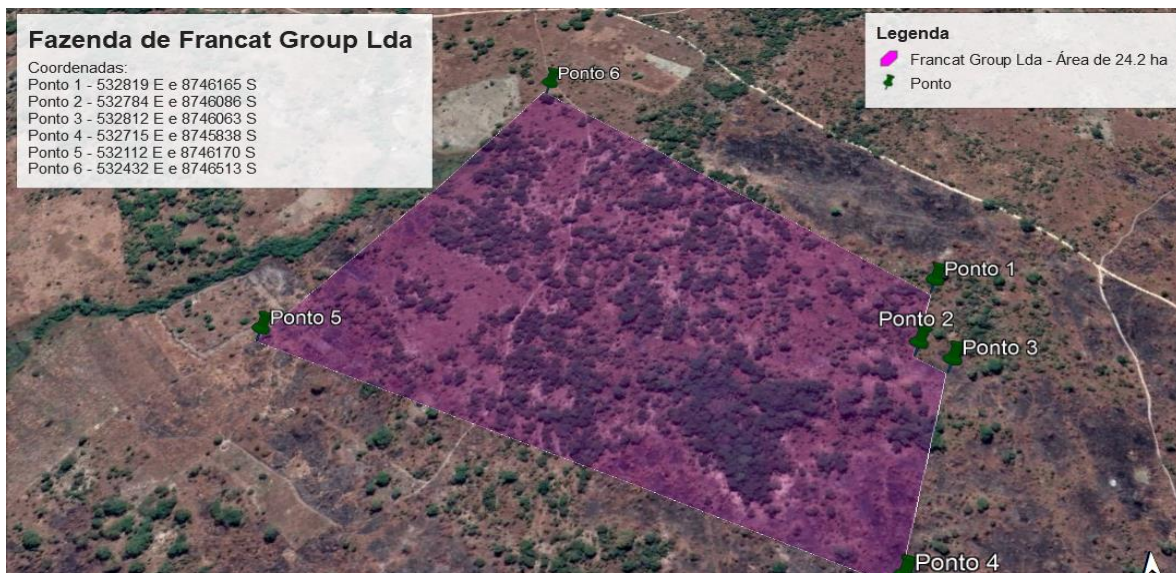
Figura 1: Extensão territorial da fazenda