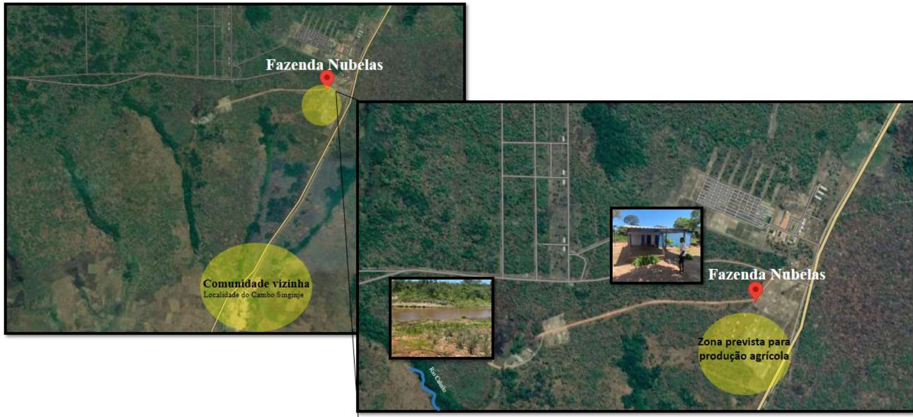
Figura 1 Mapa de localização e identificação da fazenda