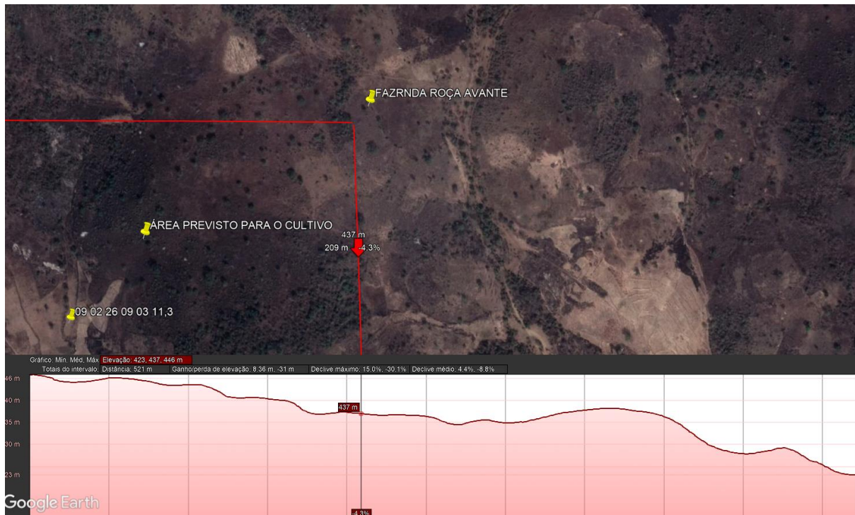
Figura 1 Mapa de localização e identificação da Fazenda Roça Avante