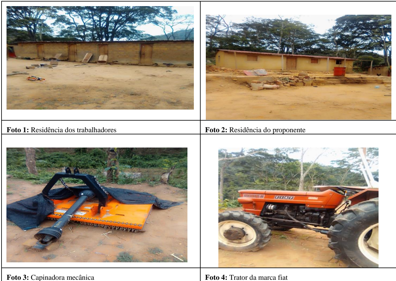
Figura 3 Registo fotográfico da Fazenda