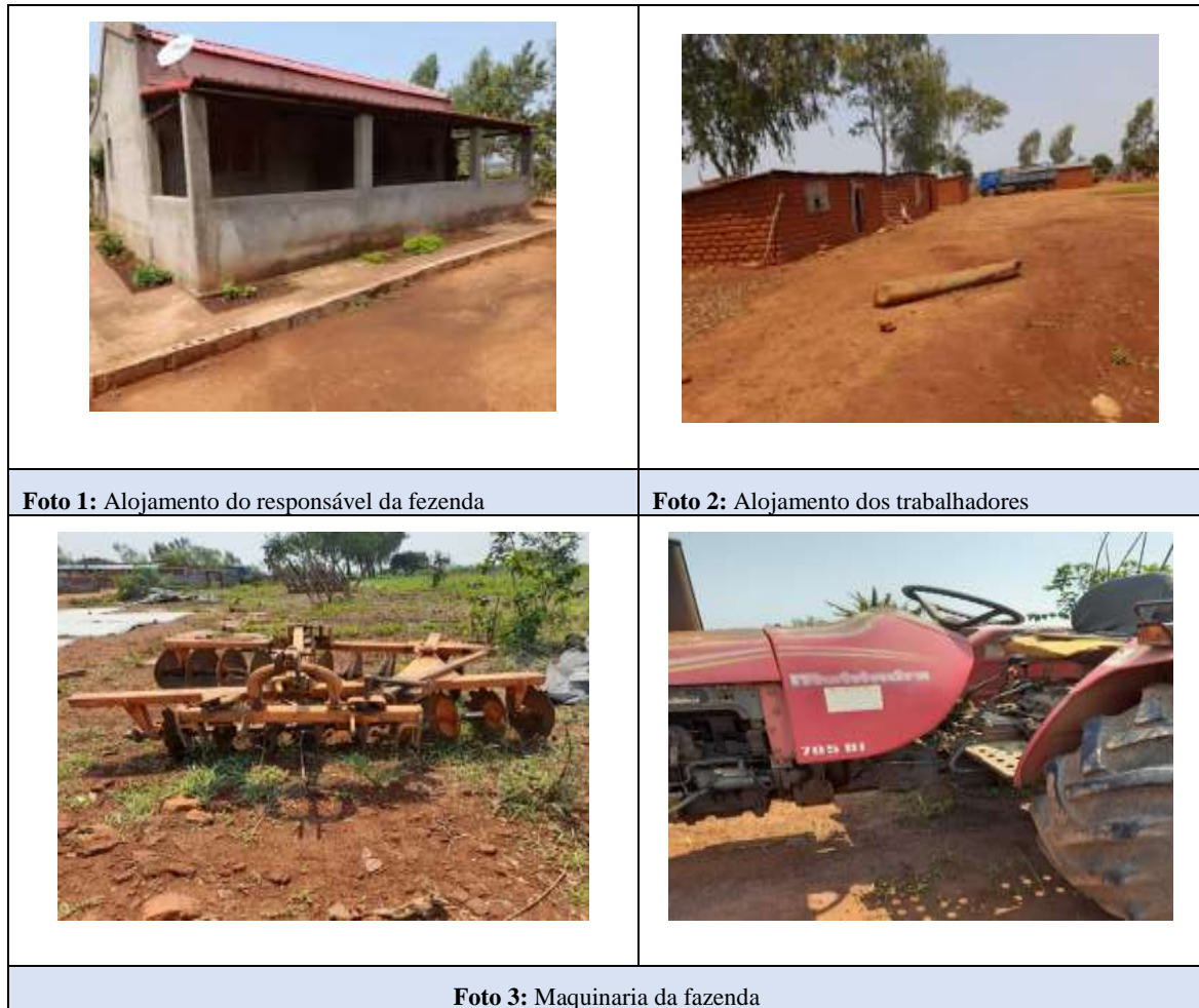
Figura 3 Registo fotográfico da Fazenda