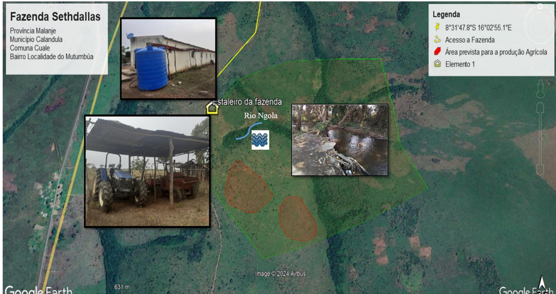
Figura 2 Áreas previstas para a construção das infraestruturas (amazém) e produção agrícola