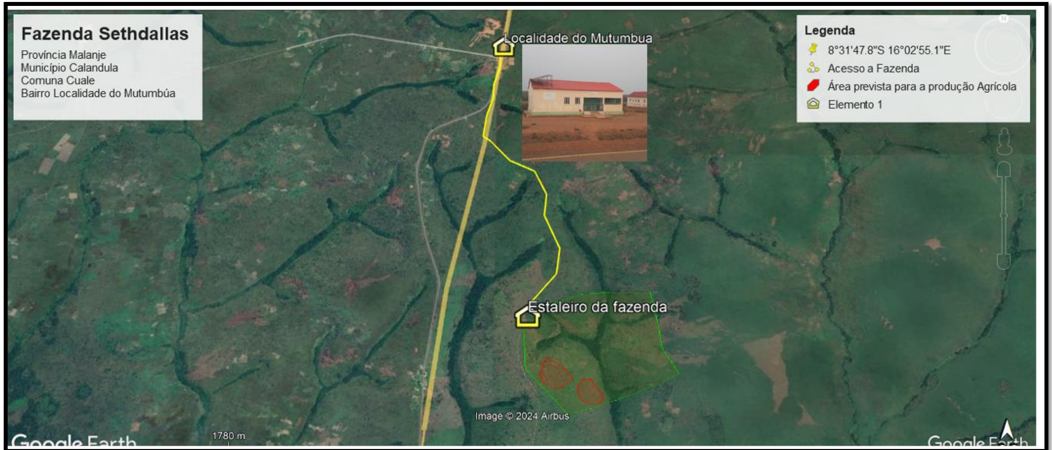
Figura 1. Mapa de localização e identificação da Fazenda Sethdallas