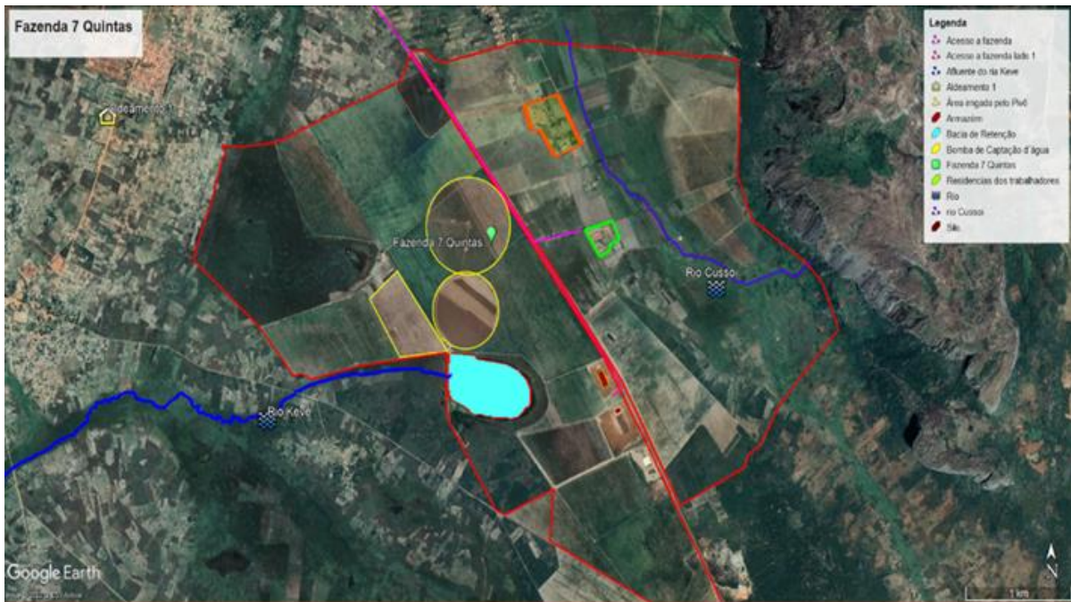
Figura 2: O subprojecto está cercado, a Oeste com o Rio Keve e Nordeste com o Rio Cussoi. Por outra, na parte Norte, encontra-se o Aldeamento 1