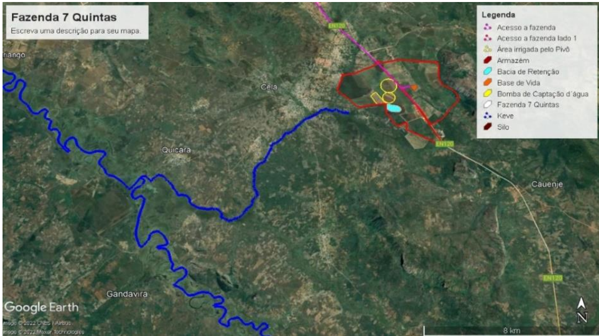
Figura 1: Localização, aldeia e bairro vizinho e rio na proximidade da fazenda