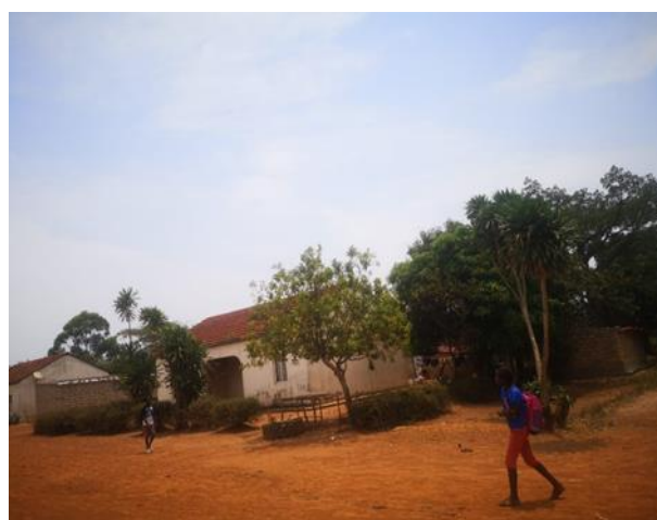
Figura 4: Aldeia 1