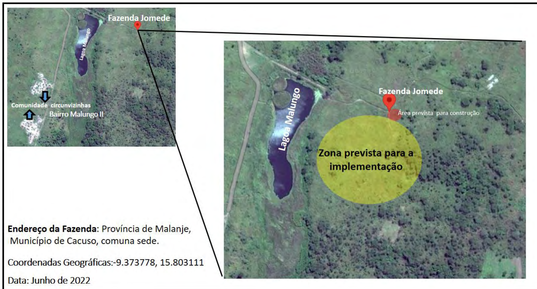
Figura 1. Mapa de localização e identificação da fazenda Organizações Jomede