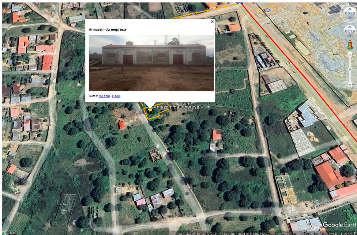
Figura 3: Mapa de Infraestrutura