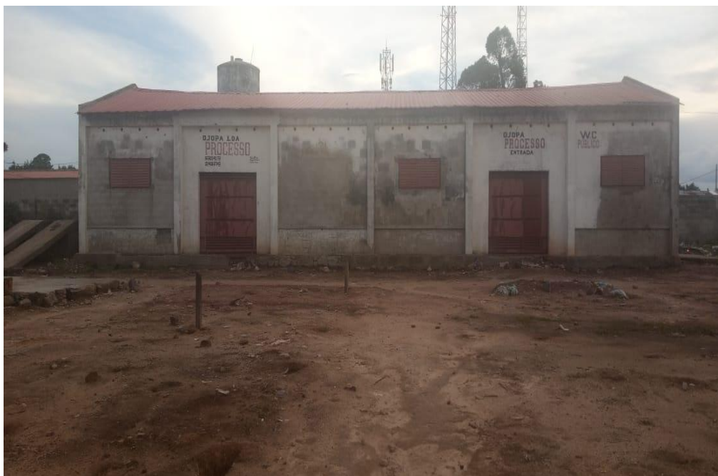
Figura 4: Armazém numa área de 1 ha ( 10.000 m2 )