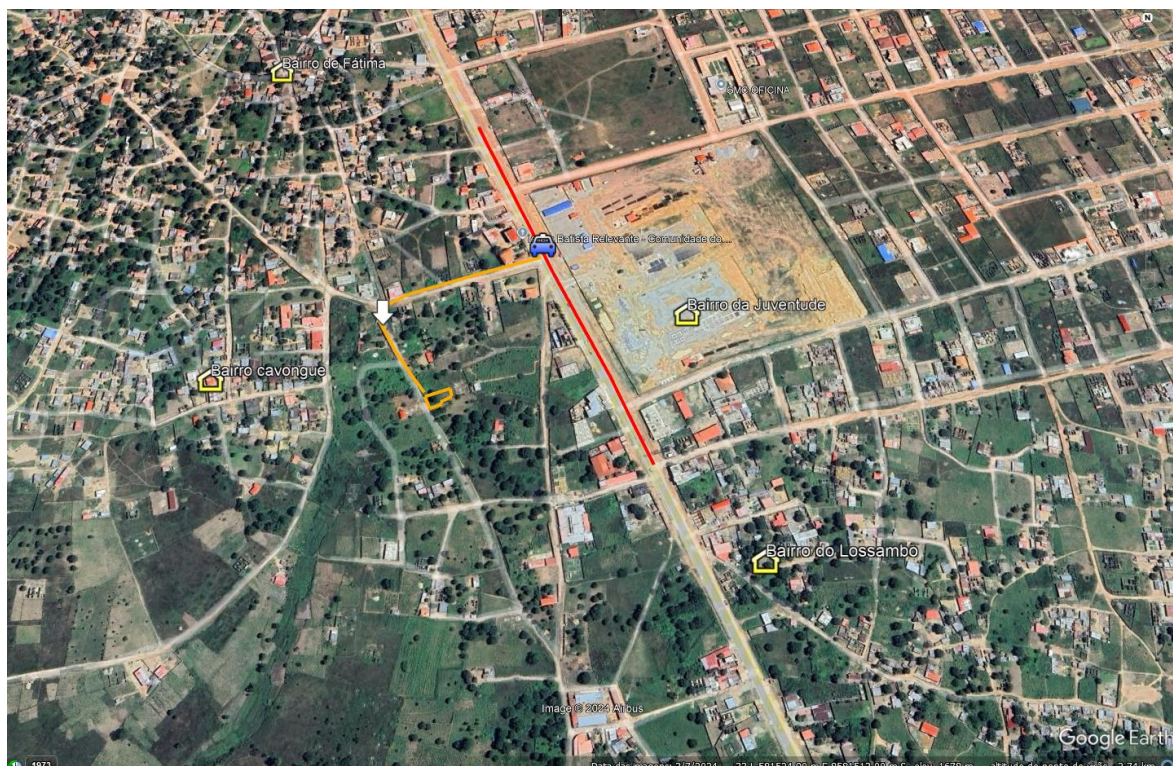
Figura 2: Mapa Ambiental e Social da Empresa