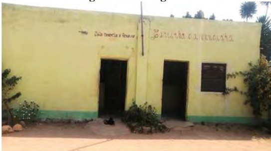
Figura 6: Loja/Bar