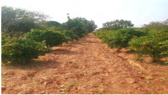
Figura 4: área agrícola