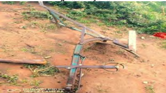
Figura 8: Charrua