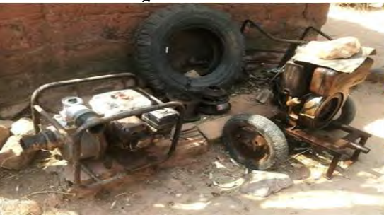
Figura 10: Motobomba