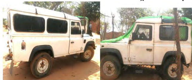
Figura 12: Viaturas