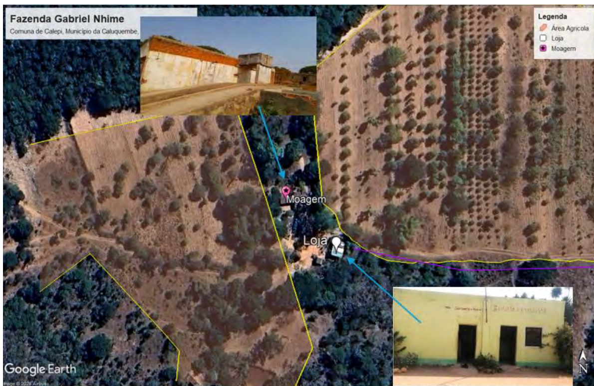
Figura 3: Infraestruturas existentes na Fazenda