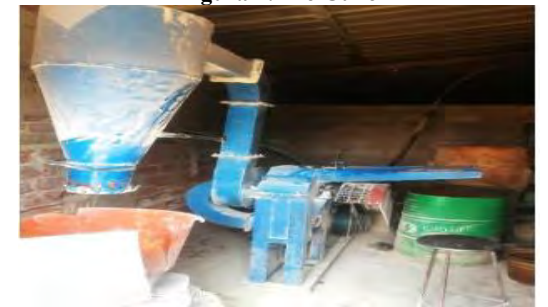
Figura 9: Moagem