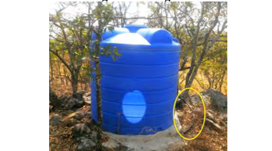
Figura 11: Tanque de água e mangueira