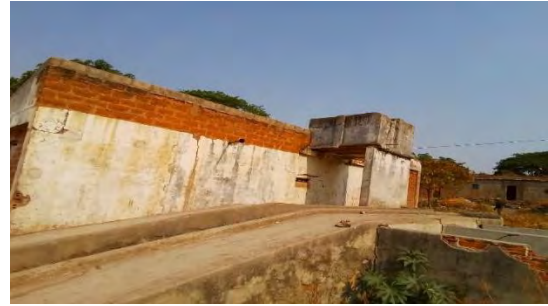
Figura 5: Moagem