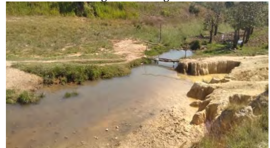
Figura 7: Rio Cuilo