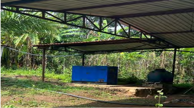
Figura 3: Gerador disponível com cobertura