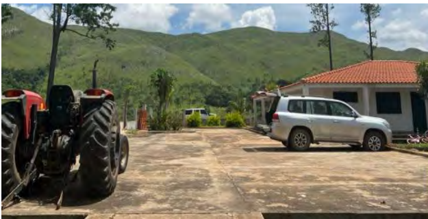
Figura 5: Tractor e duas viaturas utilizadas pelo proponente