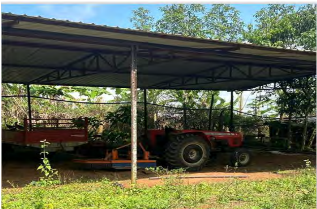
Figura 7: Alpendre das Máquinas