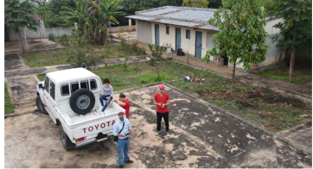
Figura 4: Infra estrutura de apoio á mao-de-obra e veículo de trabalho