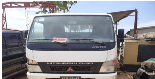
Figura 6: Terceiro veículo de trabalho disponível