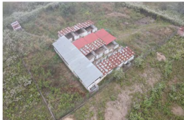
Figura 8: Infraestruras habitacionais