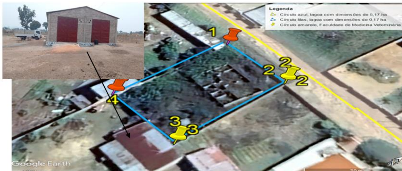
Figura 3: armazém para dar acabamento da Empresa Capaco e infraestruturas para reabilitação não prevista no PN (custo do proponente)

numa distância de 562 metros da sede da empresa temos novamente uma lagoa com dimensões de 0,17ha (destacada com círculo lilás)