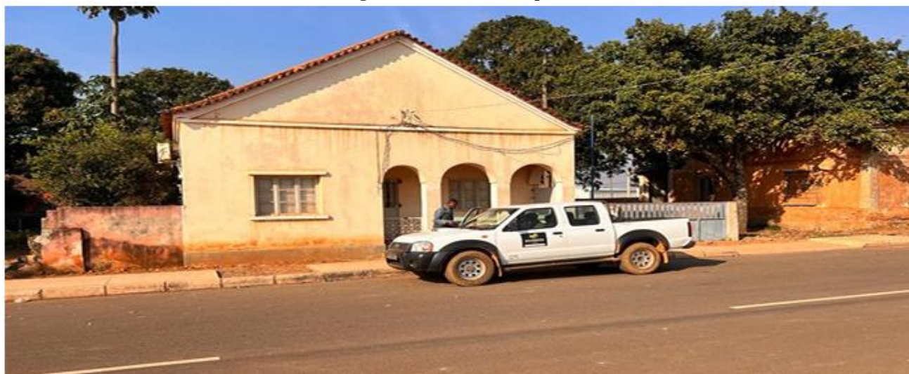
Figura 4: Parte frontal do escritório