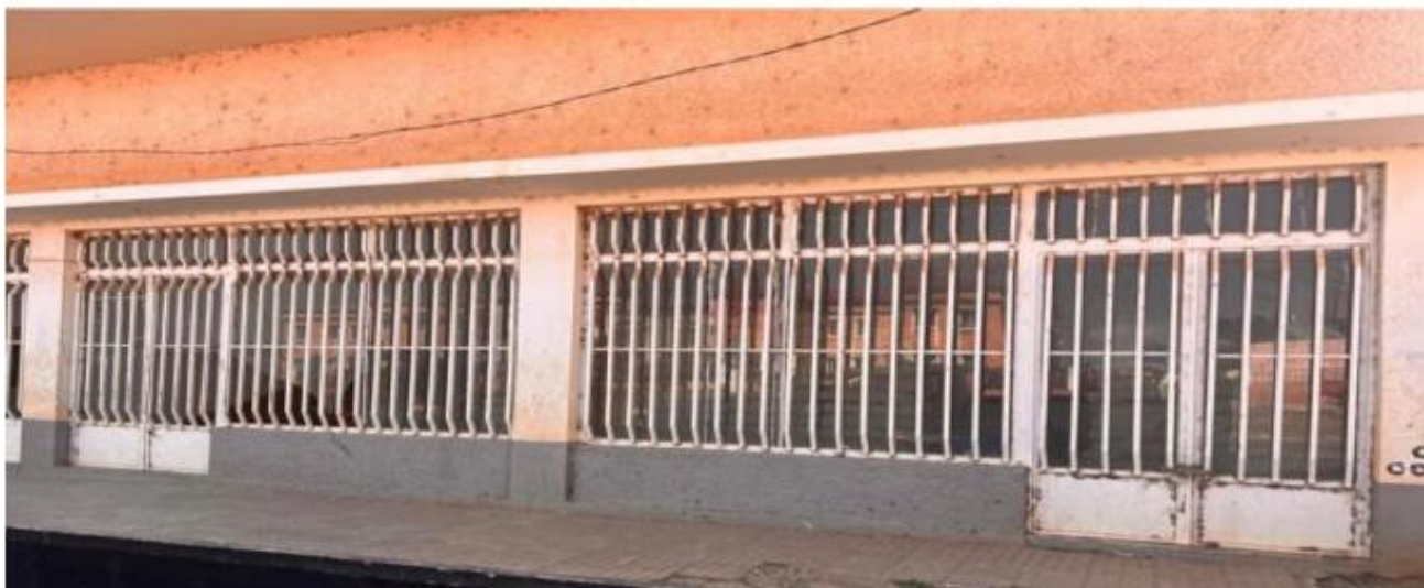
Figura 3: Armazém da empresa