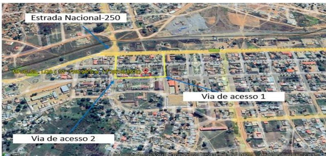
Figura 2: Localização das vias de acesso a empresa. Via de acesso 1- localizada no sentido Oeste, percorrida numa distância de 211 metros até a Estrada Nacional N° 250. Via de acesso 2- localizada no sentido Este, é percorrida numa distância de aproximadamente 250 metros.