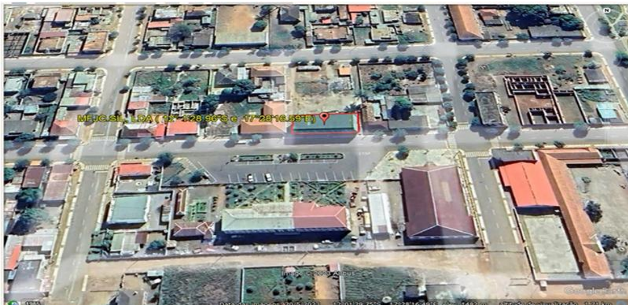
Figura 1: Localização da empresa MFJC.SIL- Prestação de Serviços, Lda na sede do município de Camacupa, Província do Bié.