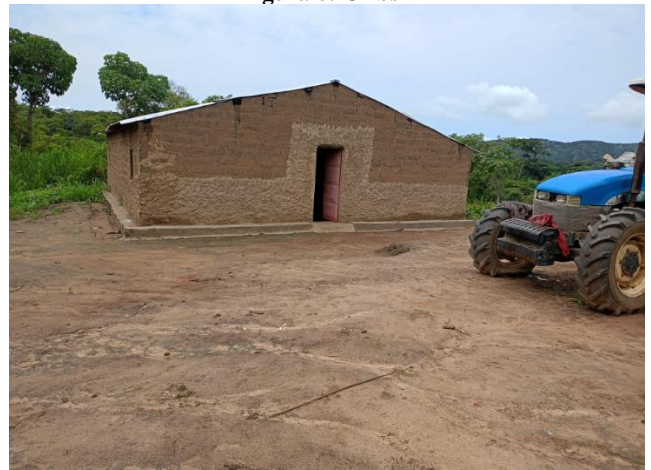
Figura 8: Residência