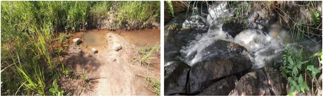
Figura 4: Fontes de água rio e o seu afluente