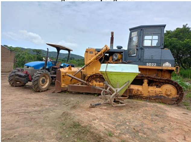
Figura 7: Equipamentos