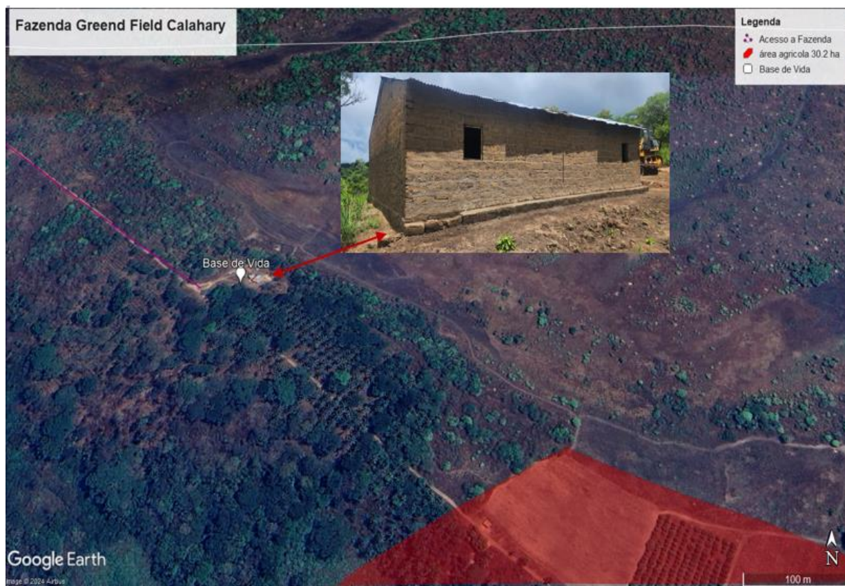
Figura 3: Infraestrutura da fazenda (Residência dos trabalhadores)