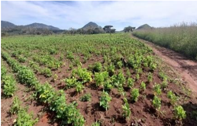
Figura 5: Campo agrícola