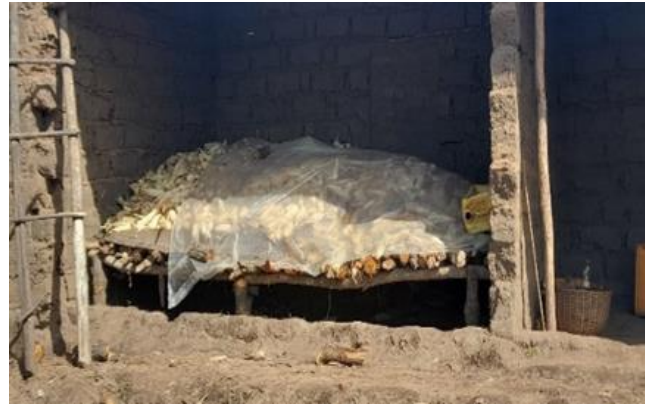
Figura 6: Cribs