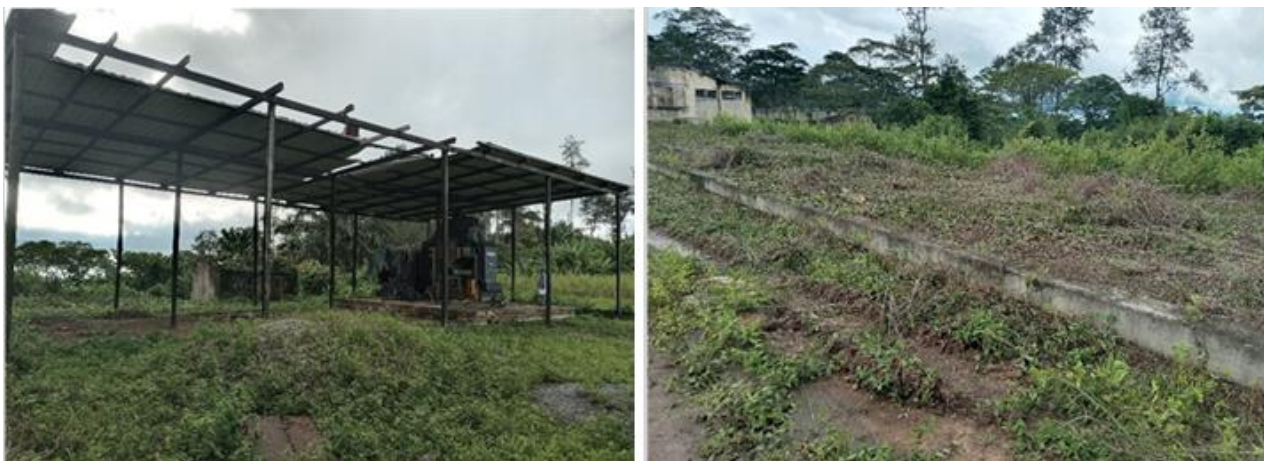
Figura 4: Alpendre e Terreiro para secagem do café