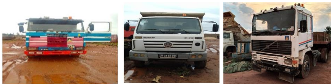
Figura 5: Viaturas disponíveis