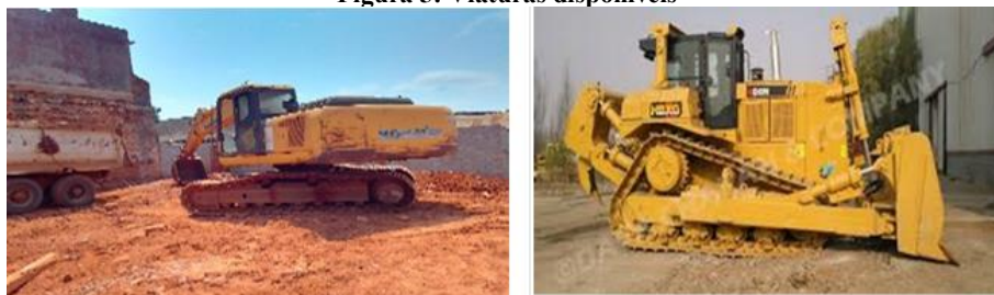
Figura 6: Tratores