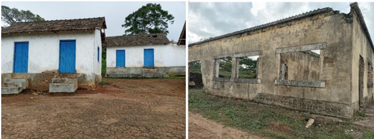
Figura 3: Residências dos trabalhadores e Armazém Fazenda