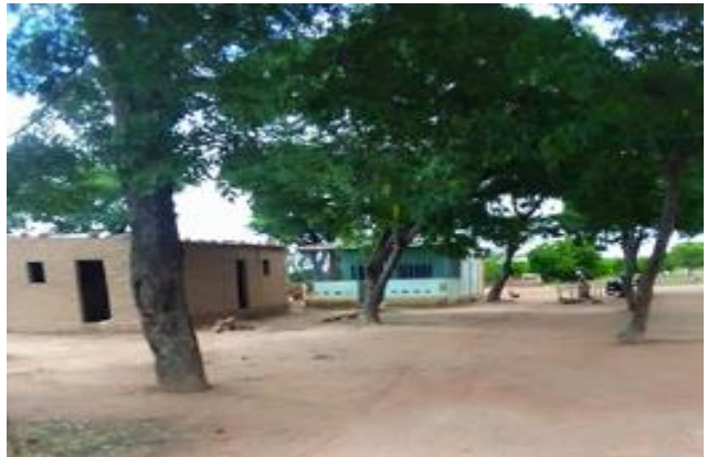
Figura 4: Residência e armazém