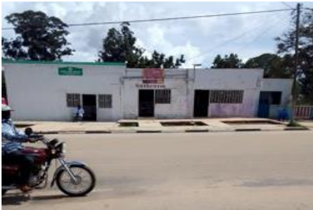
Figura 3: Complexo comercial em Caluquembe escritório, barbearia, farmácia