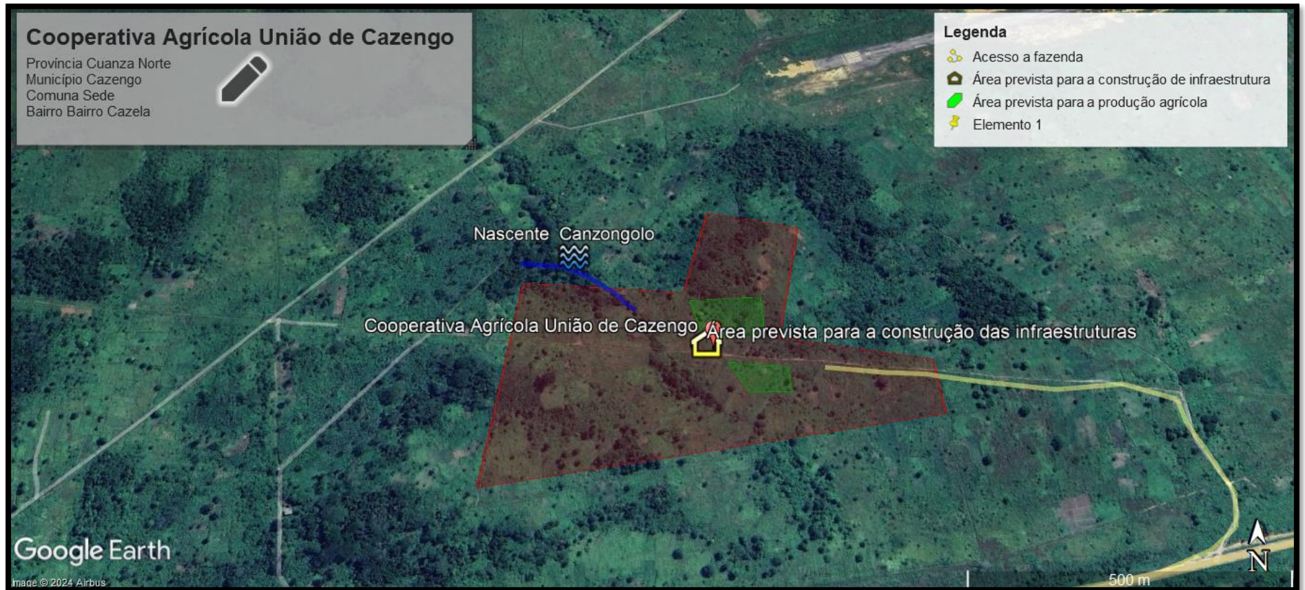
Figura 2 Área prevista para construção das infraestruturas