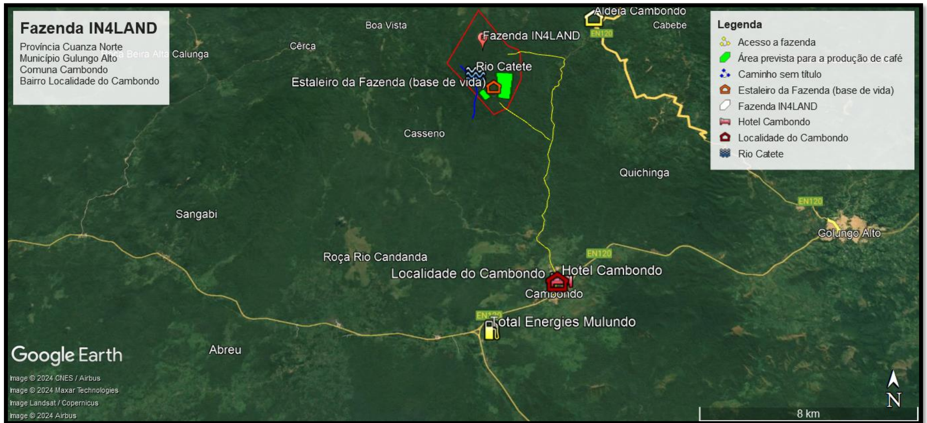
Figura 1 Mapa de localização e identificação da fazenda