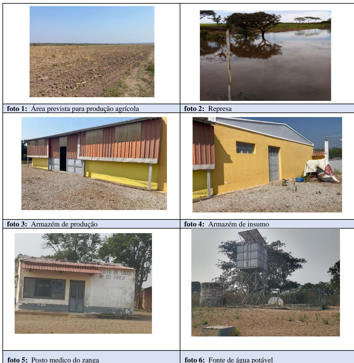
Figura 3 Registo fotográfico da Fazenda José António