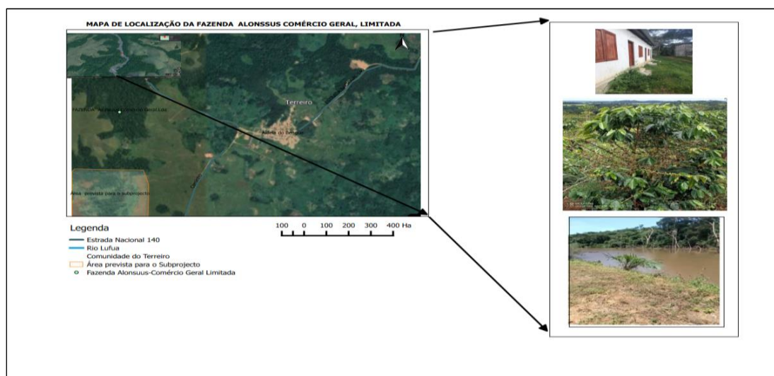
Figura 1 Mapa de localização e identificação da Fazenda Alonsuus-Comércio Geral, Limitada