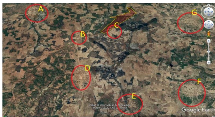
Figura 1: Localização de 7 localidades (círculos a vermelho): A – Canata com 300 habitantes; B -Calomanda com 300 habitantes; C – Desvio com 100 habitantes; D –Chiwaco com 300 habitantes; E – Chimbungo com 300 habitantes; F – Chingamba com 600 habitantes; G- Nome desconhecido com 300 habitantes.