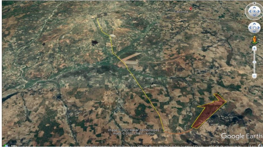
Figura 3: Estrada de acesso à Fazenda a partir da estrada secundária Caconda-Sede-Lomanda. Da sede do Lomanda ao desvio para a Fazenda são 10 759 metros (linha amarela) e daqui à sede da Fazenda são 1 857 metros (linha verde) (30/09/2022).