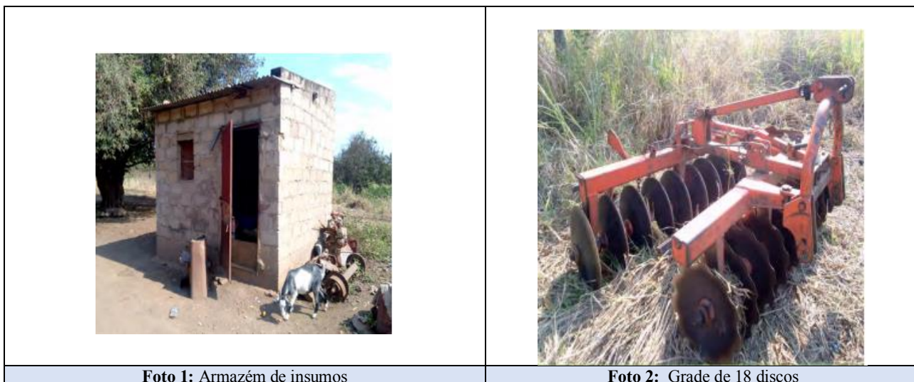
Figura 4 Registo fotográfico da fazenda