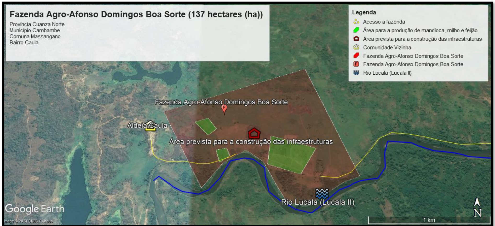
Figura 2 Área prevista para a construção de infraestrutura e produção agrícola.