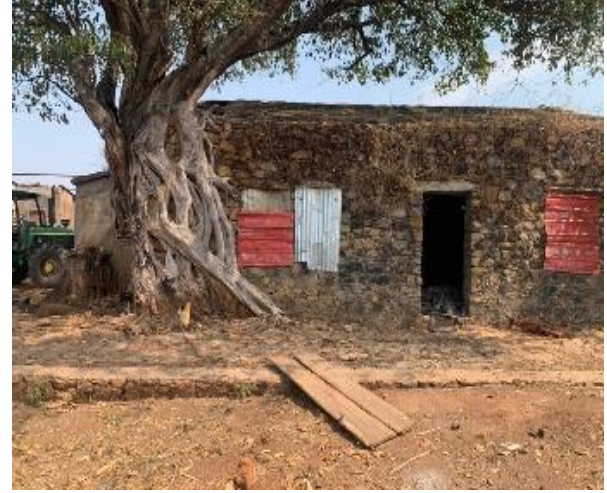
Figura 4: Residência Principal