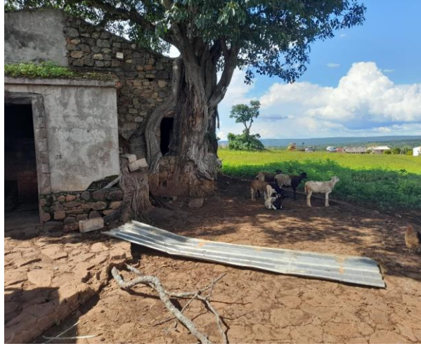
Figura 3: Residência dos trabalhadores