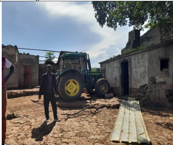
Figura 5: Trator