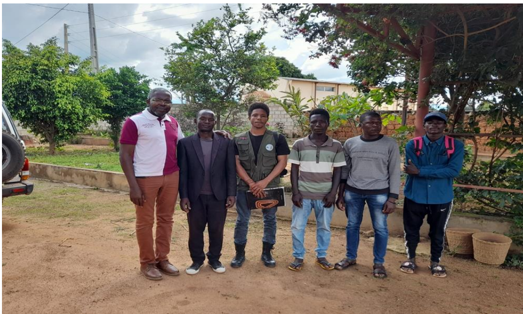
Figura 2: Fotografia em família