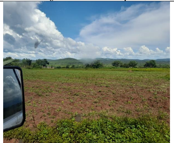
Figura 6: Campo agrícola