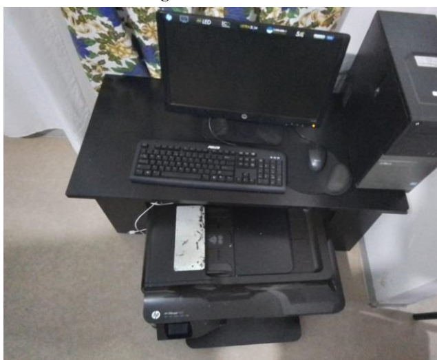
Figura 5: Computador de mesa