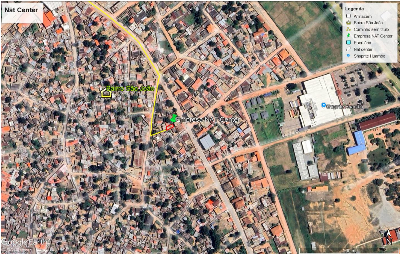
Figura 1: Localização da Sociedade Nat-Center Lda