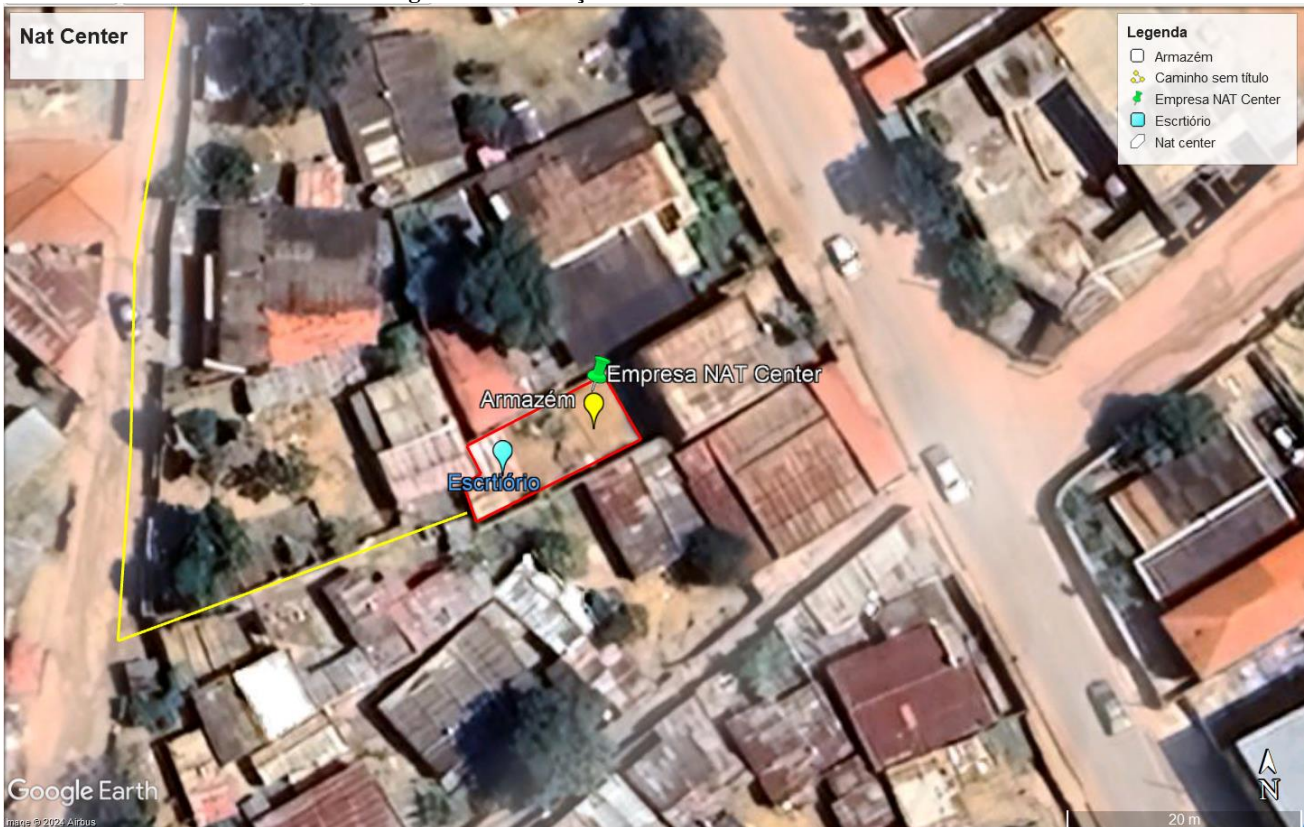
Figura 2: Infra-estruturas Existentes