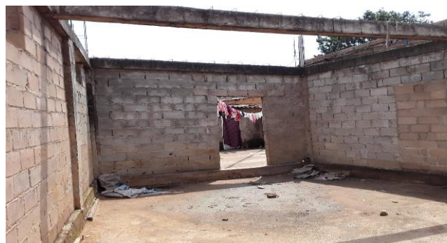
Figura 4: Armazém