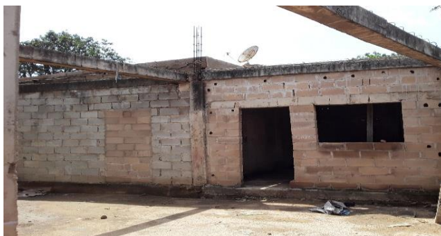
Figura 3: Escritório