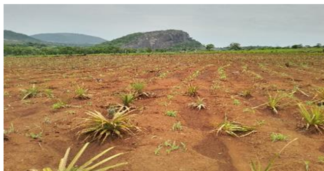
Figura 8: Área Arável com