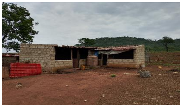
Figura 4: Galinheiro