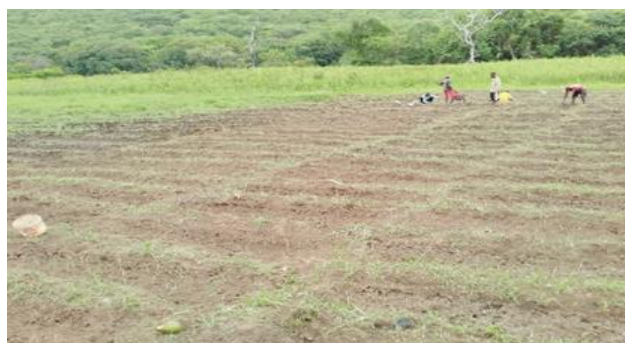
Figura 9: Área Agrícola