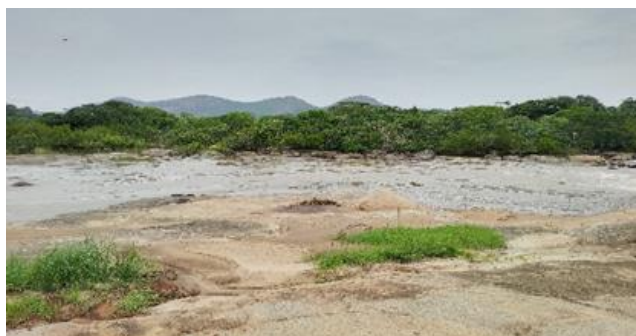
Figura 7: Berma do Rio Keve