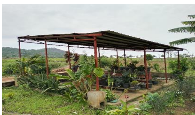
Figura 5: Viveiro