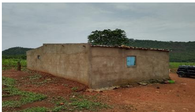
Figura 3: Residência T3