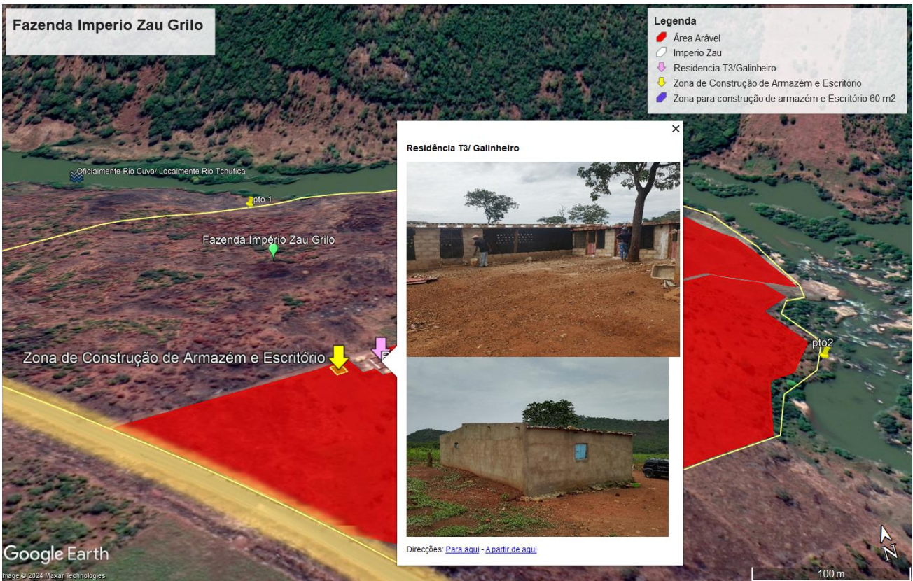
Figura 2: Futuras instalações e existentes