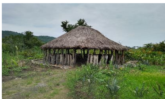
Figura 6: Jango para os trabalhadores