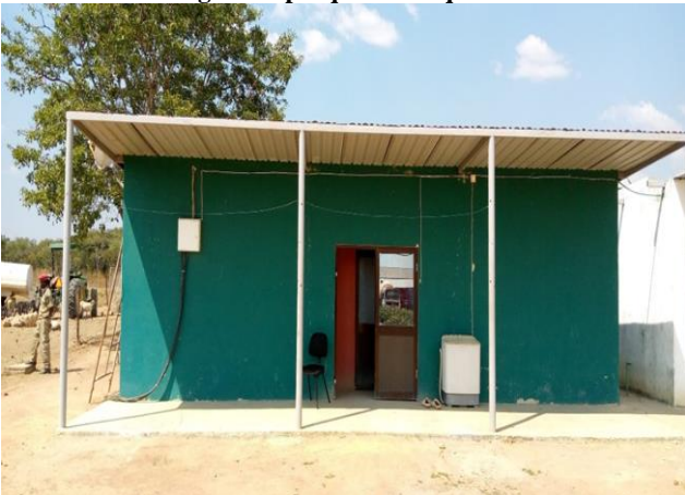
Figura 7: residência