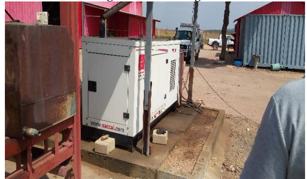
Figura 6: gerador