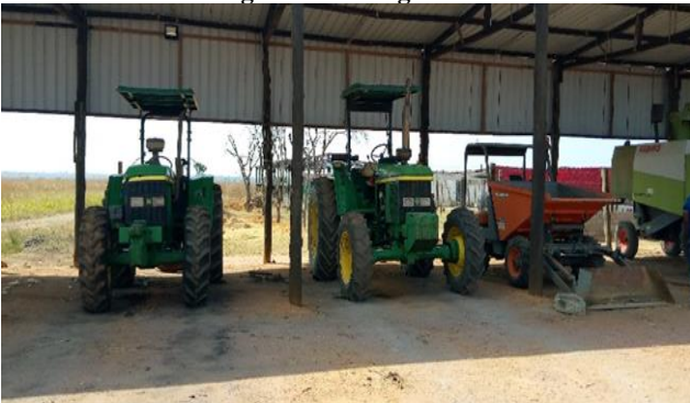
Figura 5: parque de máquinas