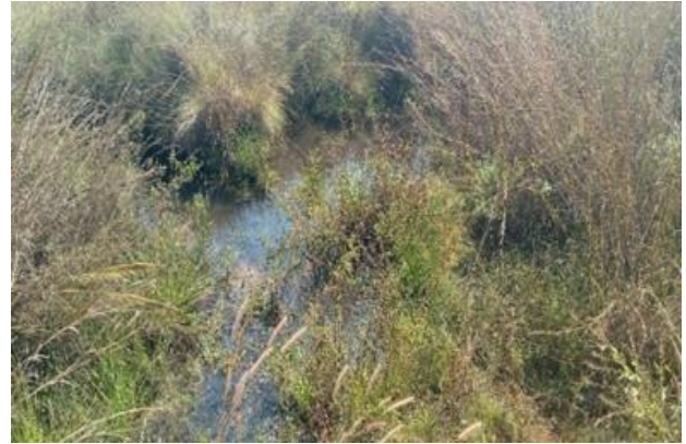
Figura 4: fonte de água