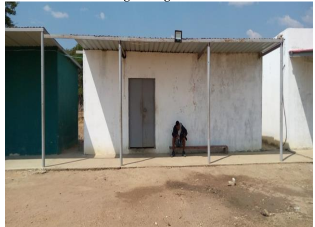
Figura 8: dormitório