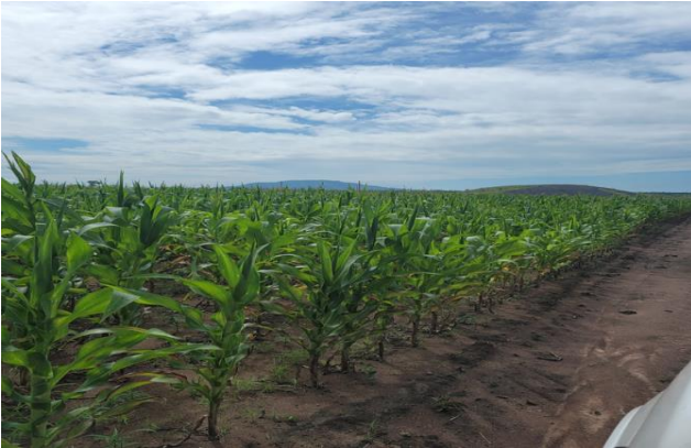
Figura 3: área agrícola