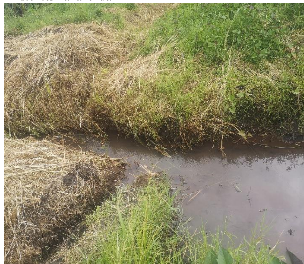
Figura 12: Fonte de água