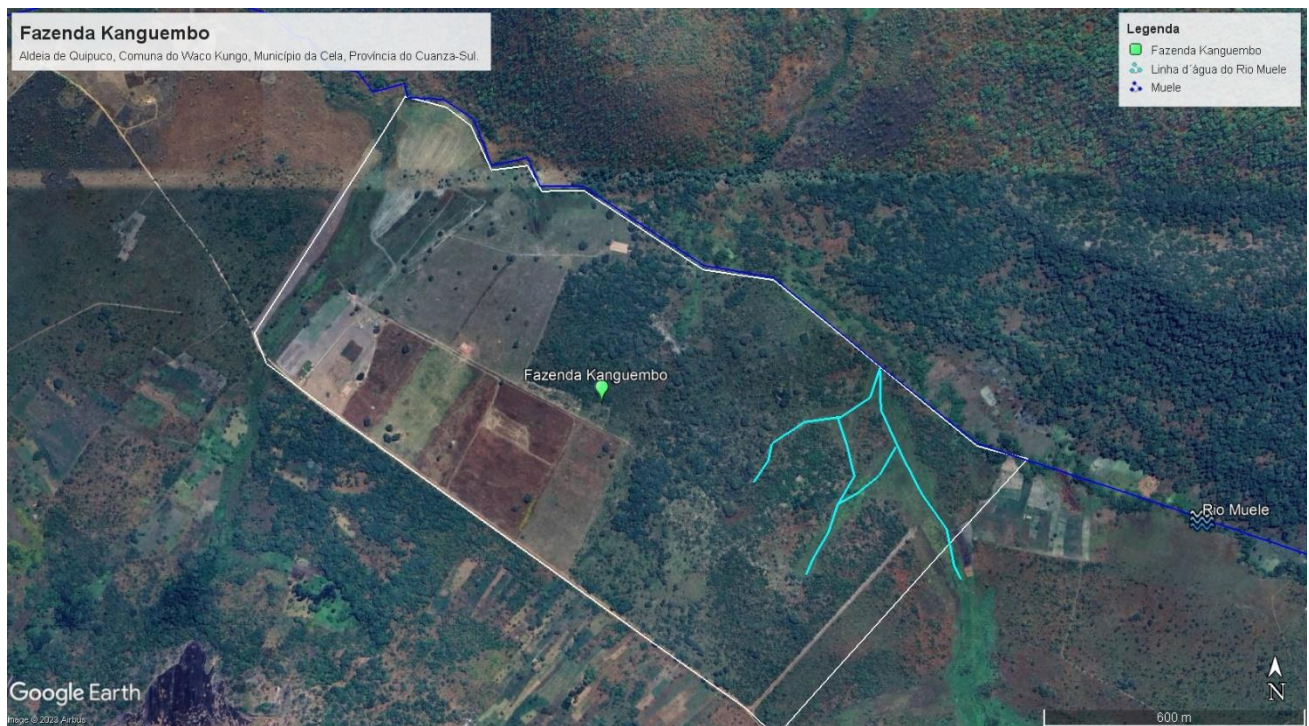
Figura 2: Delimitação da fazenda