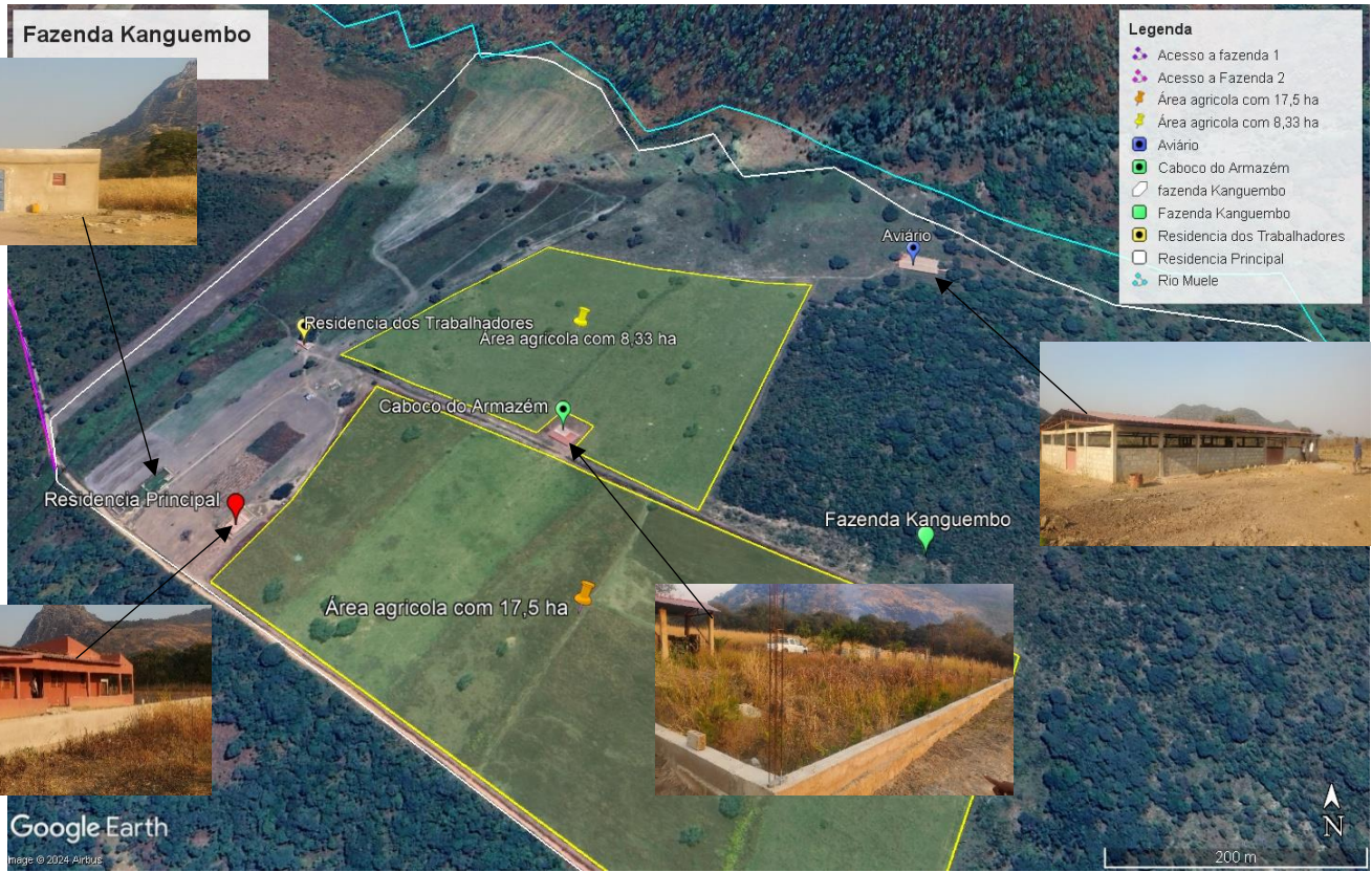
Figura 1: Infraestruturas da fazenda