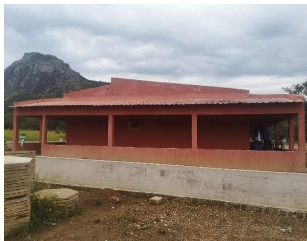
Figura 5: Residência do proponente