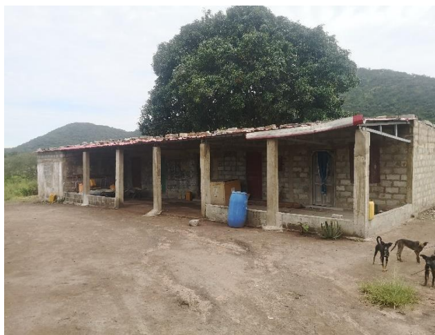
Figura 4: Residência dos trabalhadores