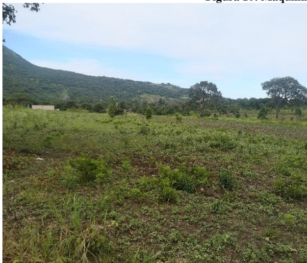
Figura 11: Campo agrícola