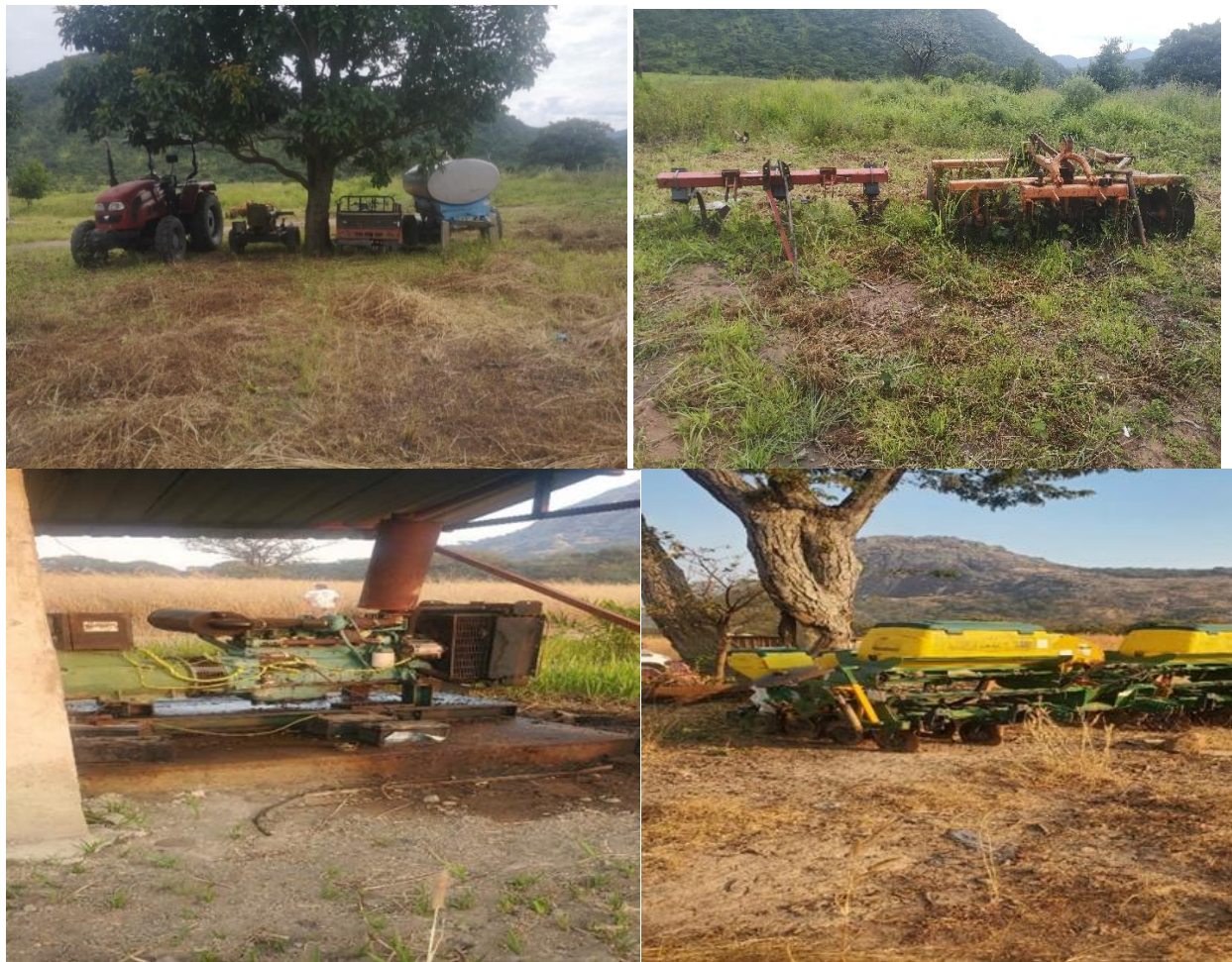
Figura 10: Máquinas Existentes na fazenda