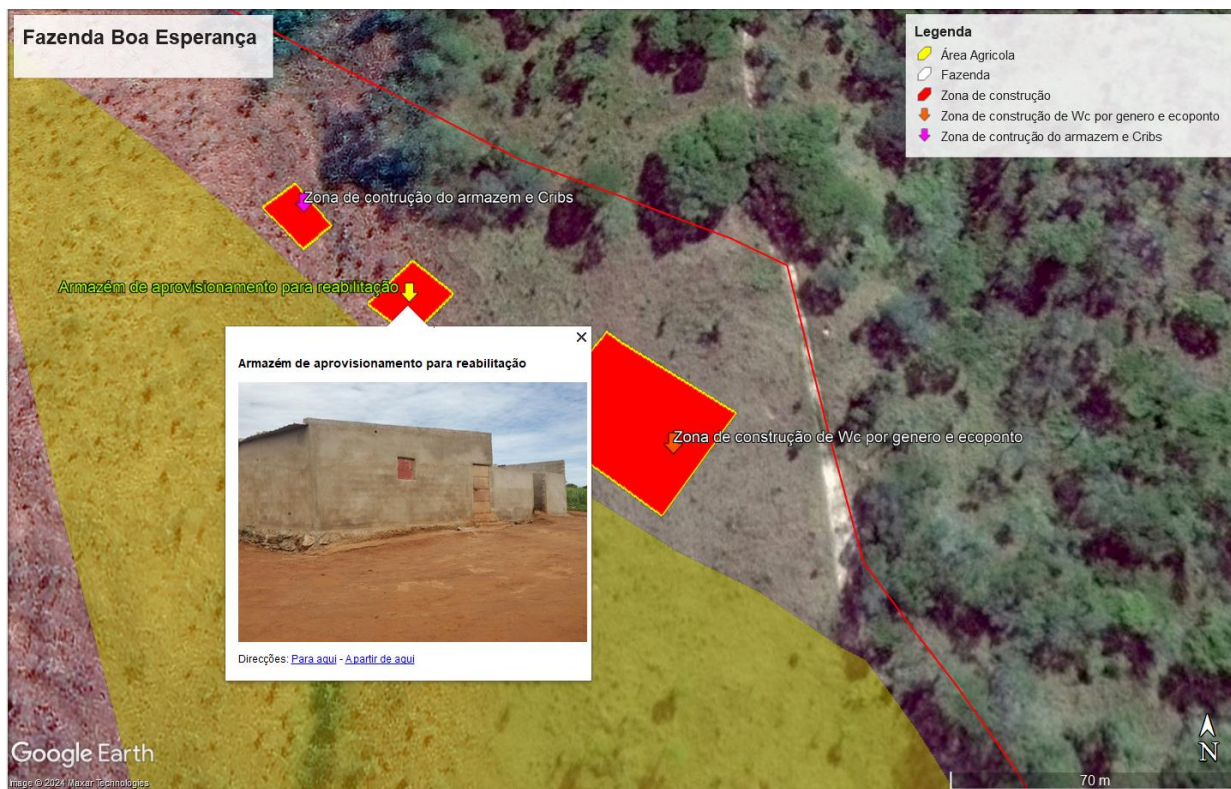
Figura 3: Infraestruturas existentes e por construir/ reabilitar